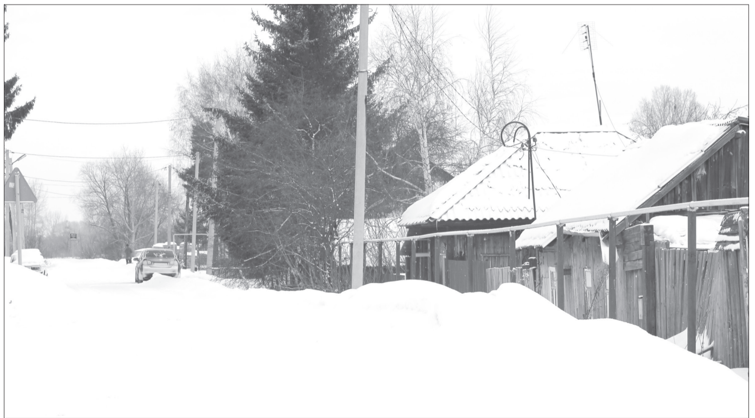
Дюжина домов на чётной стороне улицы Папанина находится перед дамбой. В 2016 году при половодье в здешних огородах плавали

У каждого тут свой огород, поэтому в местном магазине овощами не торгуют