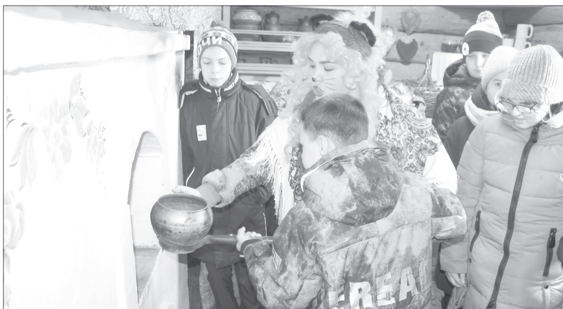
Ребят заинтересовало, как раньше с помощью ухвата ставили чугунок в русскую печь

Развитие через игру. Ребята побывали в двух точках острога. В амбаре школьники играли в традиционные на Руси игры, знакомились со старинными предметами быта и музыкальными инструментами. В избе грелись у печки, пили аромат-