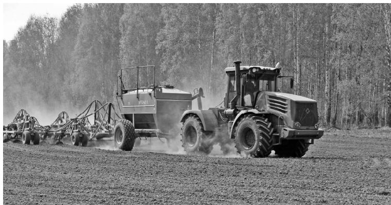
➤ На «Кунгуровом» поле