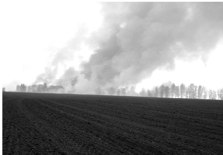
➤ Огонь стеной

Такую задымлённую весну, как нынче, викуловчане не припомнят давно. А в Тюменской области по официальным данным такого положения дел в пожароопасный период не было десять лет.