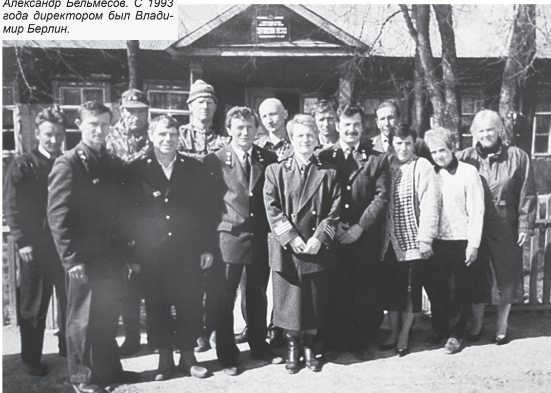
Коллектив Юргинского лесхоза, 1997 год

Ольга КОНОВАЛОВА Фото из архива Юргинского лесничества