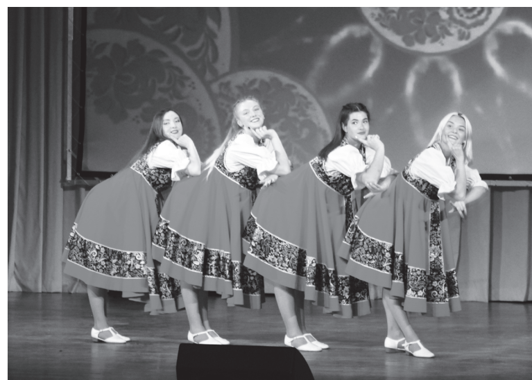
Русские народные мотивы