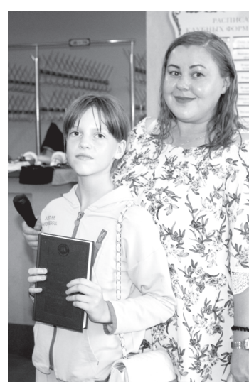
Специалисты Центра «Лидер» отметили знатоков истории Тюменской области