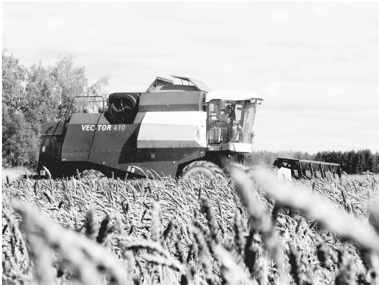
Юргинские аграрии приступили к уборке урожая