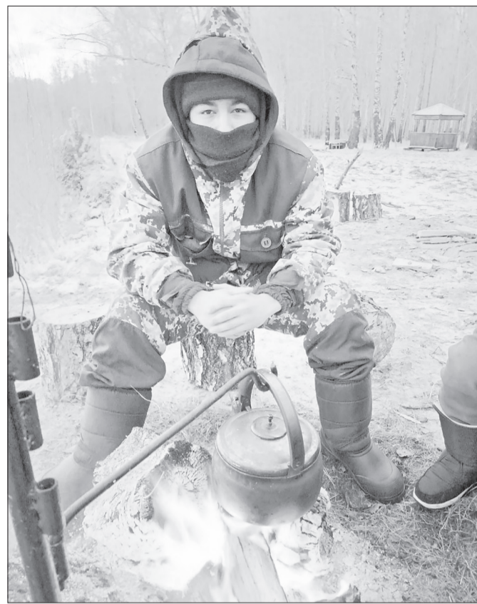
☑ В ожидании горячего чая.