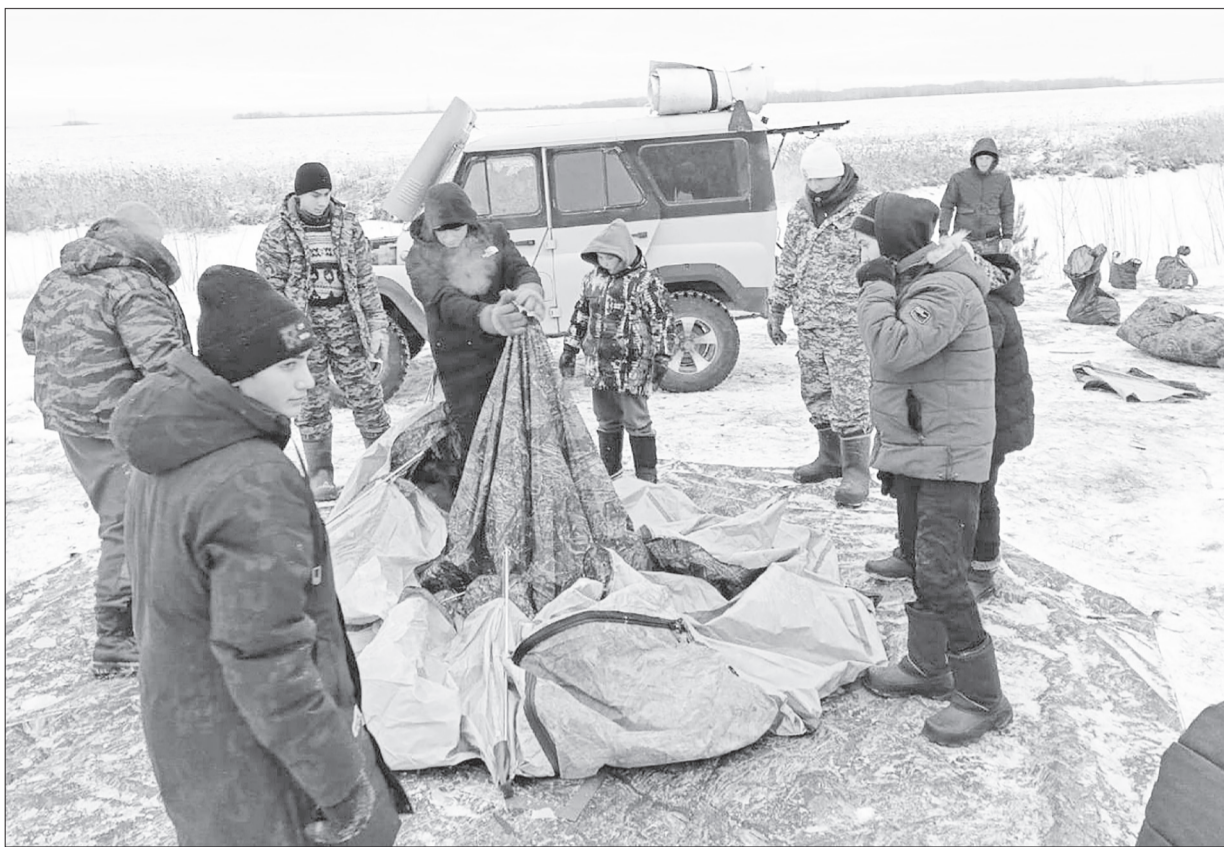
☑ После марш-броска ребята занялись обустройством палаточного лагеря.

Читайте новости первыми на сайте www.sp72ru.ru и в наших группах соцсетей