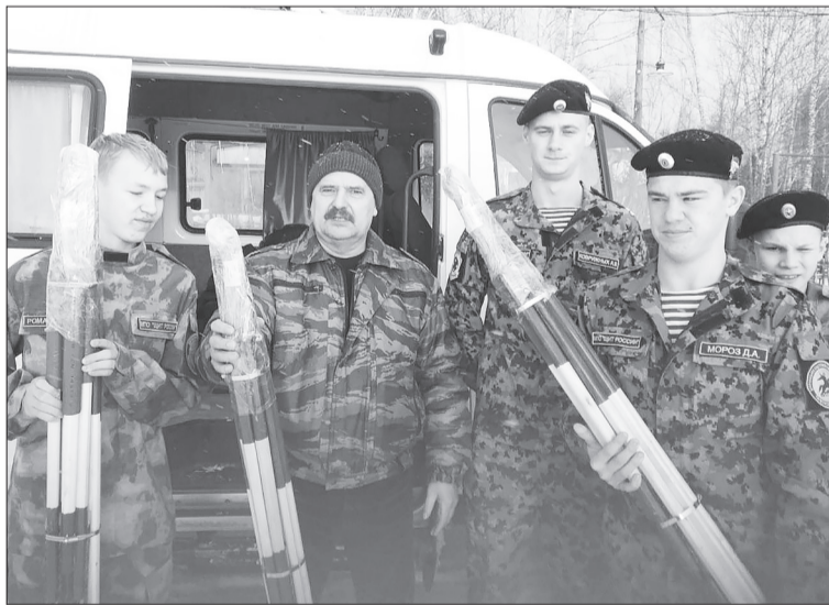
Момент погрузки посылок и сапёрных щупов в Казачьем подворье. В этот же день была проведена экскурсия для классов добровольной подготовки к военной службе.

Участники СВО чувствуют тепло и поддержку малой родины