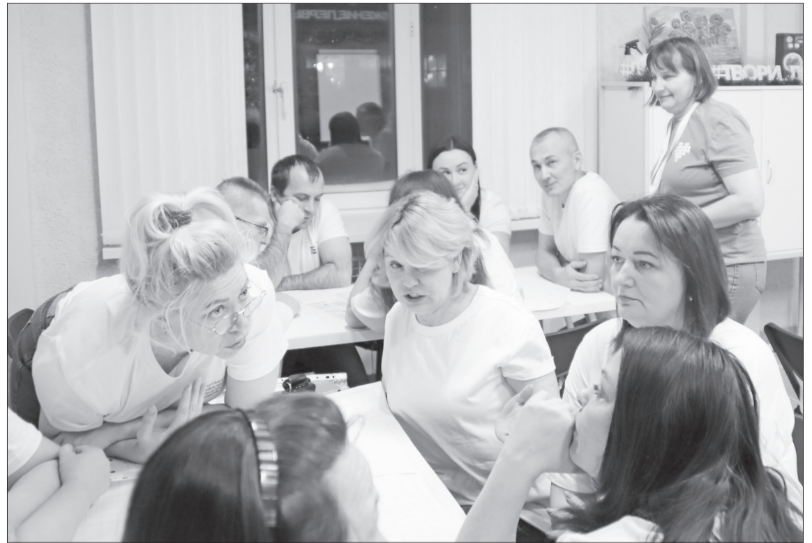
Идёт обсуждение проекта «Поём двором».

Во время обсуждения будущих проектов эмоции просто зашкаливали, ведь здесь собрались действительно творческие, активные, неравнодушные. Те, кто каждый день