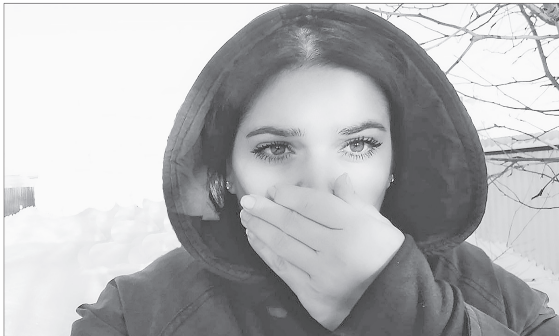
❗ Агрессивному воздействию мороза подвергаются ушные раковины, нос, щёки, кисти рук.

В первую очередь агрессивному воздействию подвергают-