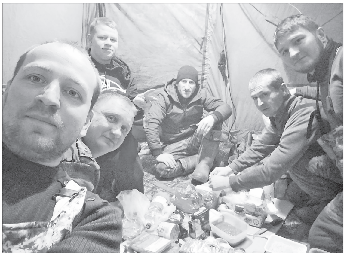
☑ Вечерняя трапеза руководителей полевого выхода.

– Это красивое, открытое место отлично подошло для лагеря, – продолжил Дмитрий. – В скором времени на земле выросли палатки, ребята отправились за хворостом, после чего приятно закоптили буржуйки. Горячий чай, приготовление пищи, настоящая туристическая романтика, –