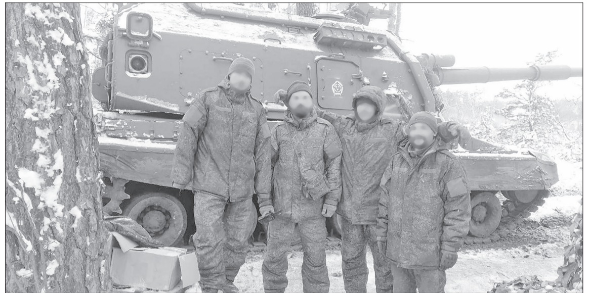
23 ноября, ДНР. Экипаж самоходной гаубицы, в составе которого боевые задачи выполняет и наш боец с позывным Анубис.

– Собираюсь находиться в строю, пока не закончится