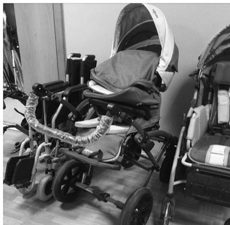
В арсенале мобильной службы проката технических средств реабилитации есть всё самое необходимое

заявления, к которому прилагаются следующие документы: