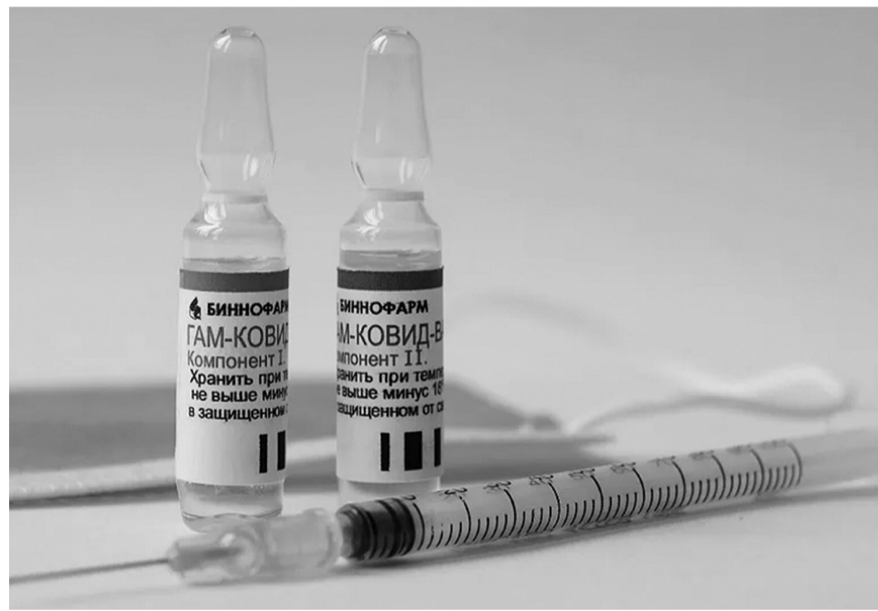
Вакцина "Гам-КОВИД-Вак" есть в Сорокинском районе. В скором времени поступит и вакцина "Спутник Лайт". Сделать прививку можно в любой момент

"До вынесения официального решения не рекомендуем жителям делать выводы самостоятельно о произошедшей ситуации и об описываемых событиях. Для разбора, проверки и ответов на вопросы пациент может обратиться в департа-