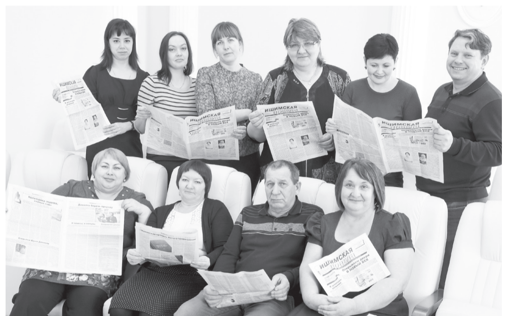
Когда в 2019 году мы отмечали 100-летний юбилей газеты, никто и представить не мог, что год спустя мир охватит пандемия.