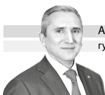
АЛЕКСАНДР МООР губернатор Тюменской области

Дорогие ветераны! Уважаемые земляки! Поздравляю вас с Днём Победы! Для подавляющего большинства