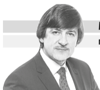
МАКСИМ АФАНАСЬЕВ глава города Тобольска

Дорогие тоболяки! Дорогие ветераны и труженики тыла!