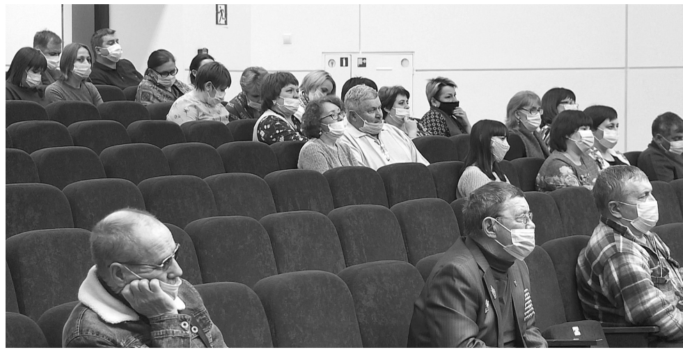
Зал почти пустой. На сход граждан пришли в основном пожилые люди и среднего возраста. Молодых можно было по пальцам пересчитать, они общаются с властью по-современному – на просторах интернета

В центральный коллектор посёлка Голышманово ежедневно поступает до 700 кубометров канализационных стоков по самотечным трубопроводам водотведения и ещё 230 – из выгребных септиков. Нередко очистные сооружения были перегружены. Поэтому в 2020 году приступили к модернизации КОСов. Их суточную производительность увеличи-