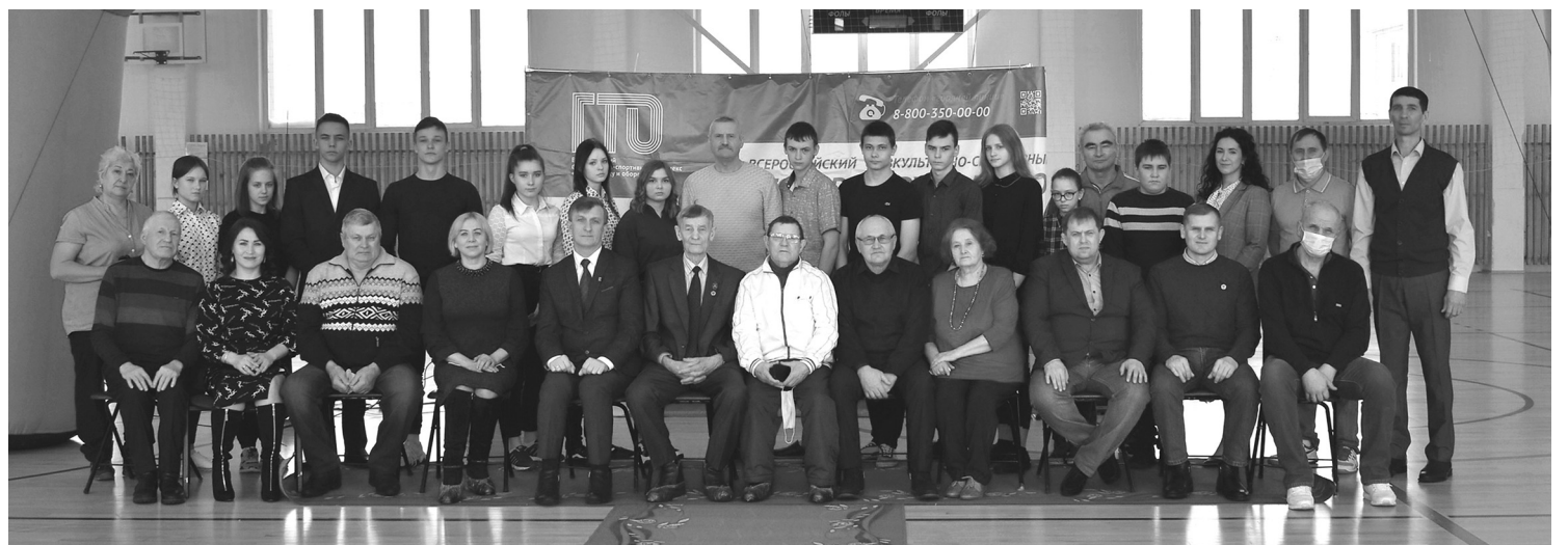
Учащимся Голышмановской школы вручили значки ГТО на стадионе «Центральный» в рамках мероприятия, приуроченного к 90-летию этого физкультурно-спортивного комплекса