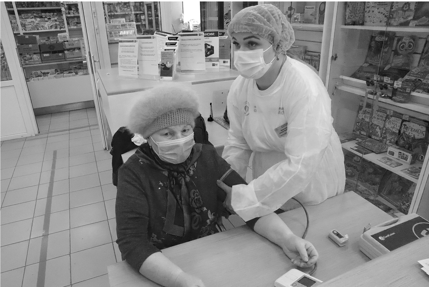
На Голышмановском почтамте акция «Здоровое сердце» проводится второй раз. Нынче возможностью пройти медицинское экспресс-обследование воспользовались 15 человек