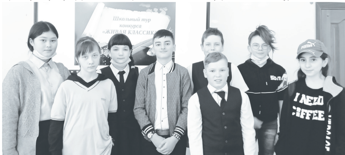
Емуртлинские школьники приняли активное участие в конкурсе.

Лидия СОСНИНА.