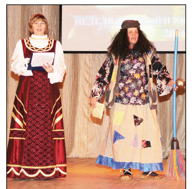
• Сцена из выступления.

Завершилось праздничное мероприятие награждением. Для многих присутствующих это стало самым приятным моментом, а те, кто не посещает библиотеку вообще, или делает это редко, смотрели на отмеченных почётными грамотами одноклассников с завистью. Несомненно, прошедшее мероприятие многих из них подтолкнёт к чтению книг, и, как знать, может быть кто-то из сегодняшних «незнаек» уже в следующем году поднимется на сцену как лучший читатель.