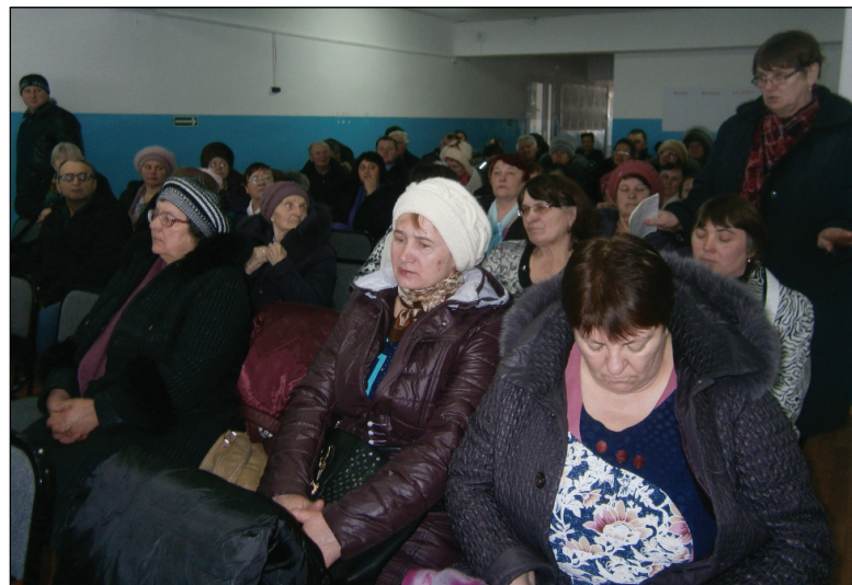
• Вопросы сельчан были глобальные: касались строительства дороги, газификации территории, водоснабжения.