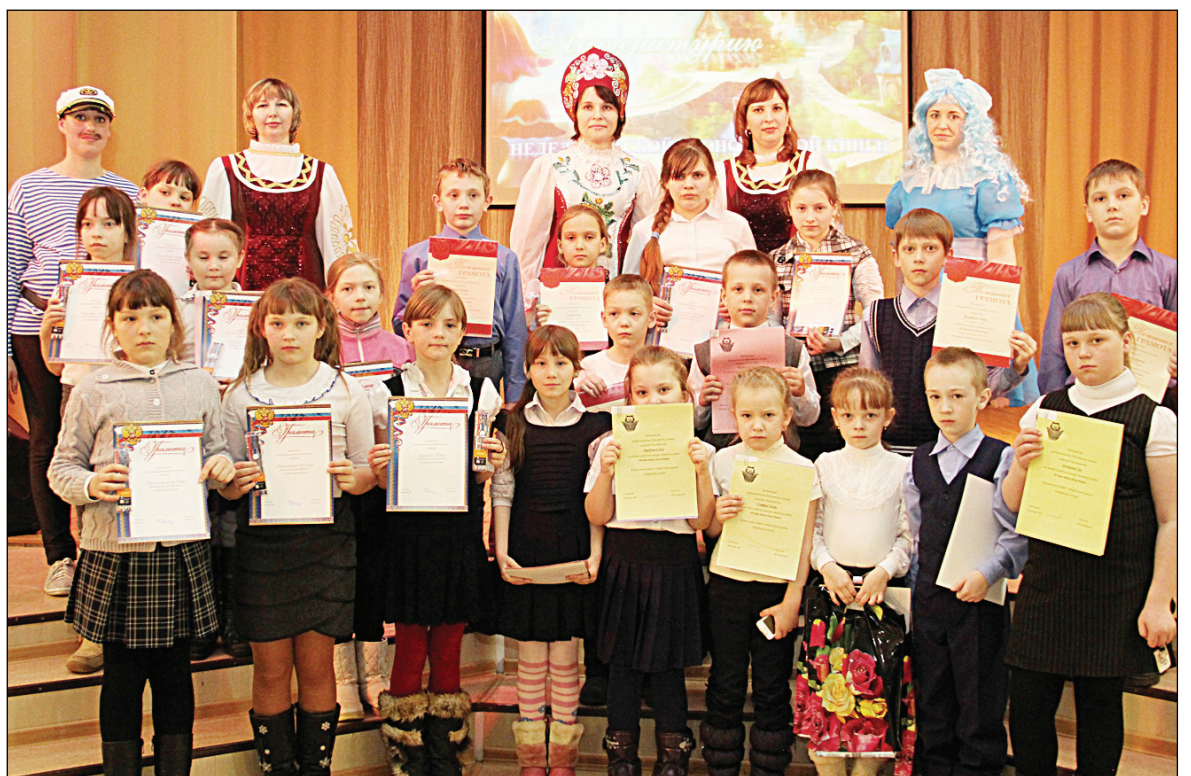
• Ведущие и юные победители объявляемых в течение года литературных конкурсов.

24 марта в районном Доме культуры для детей младшего школьного возраста состоялось театрализованное представление, подготовленное работниками районной взрослой и детской и сельских библиотек, посвящённое открытию «Недели детской книги». Это мероприятие является всероссийским и традиционно проводится в дни весенних каникул.