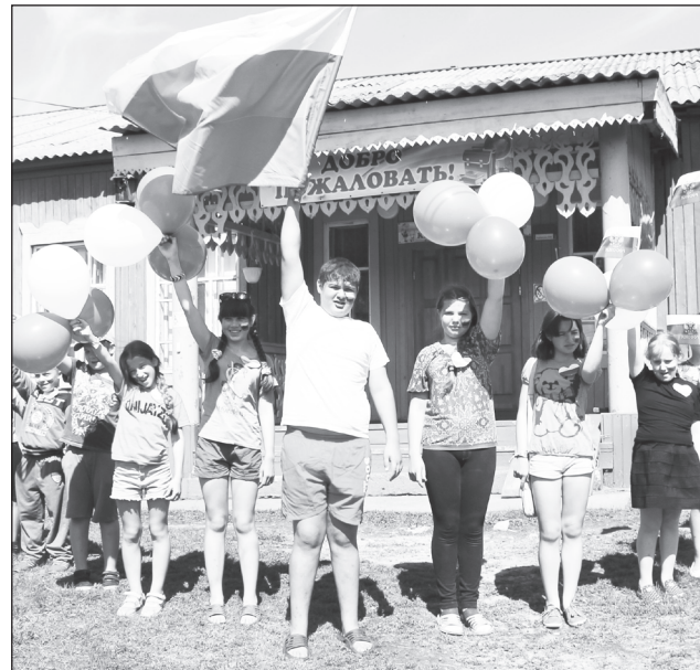
Крашенининские ребята – частичка России.

Вот и наступили долгожданные каникулы. Взрослые люди – общественность, учителя, родители – стараются, чтобы летний отдых детей был интересным, разнообразным и полноценным. С 1 июня свою работу начали пришкольные лагеря.