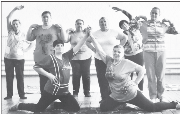
Коркинские пенсионеры – за здоровый образ жизни.