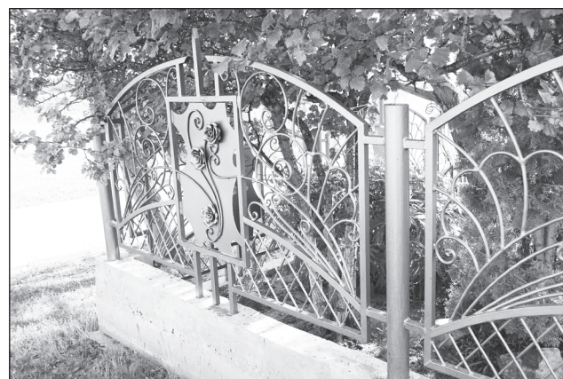
Фрагмент кованой ограды.

семейном быту. И в этом деле у художника грандиозные планы. Собрался делать большую муфельную печь, выполнять серьёзные гончарные работы. Правильно ведь кто-то когда-то давно подметил: если человек однажды коснётся глины, потом ему трудно будет от неё «отклиться». На генном уровне, наверное, это у человека заложено.