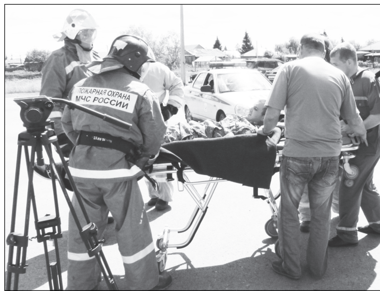
Огнеборцы 143 ПСЧ всегда готовы прийти на помощь пострадавшим.