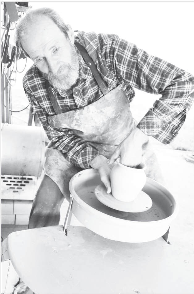
Вот и горшок родился!

фотографии, а уносят, можно сказать, настоящие произведения искусства, так как грамотно подобранное паспарту и соответствующий багет заставляют зрителя сосредоточиться на художественной работе, увидеть всю её красоту.