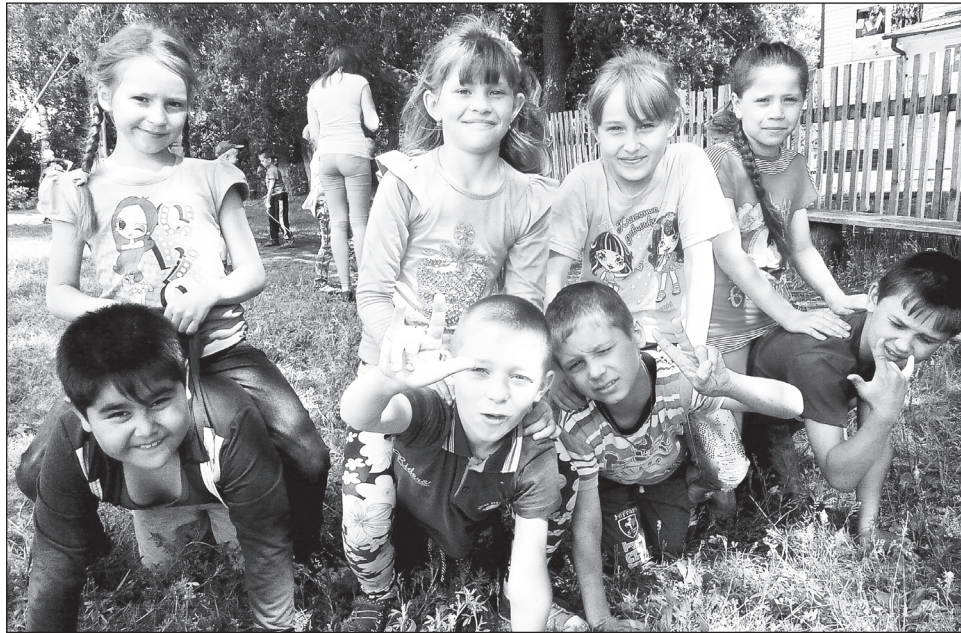
Солнечные улыбки суерских школьников.

На базе Суерской школы в самом разгаре работа летнего пришкольного оздоровительного лагеря. 155 воспитанников от 6 до 14 лет с пользой проводят свои каникулы. Лето – это, прежде всего, солнечные и тёплые деньки, поэтому наш лагерь называется «Солнышко».