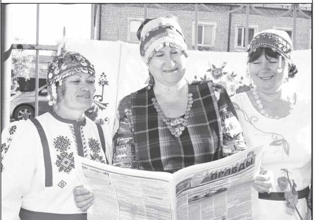
Чернаковцы – постоянные читатели «Знамёнки».