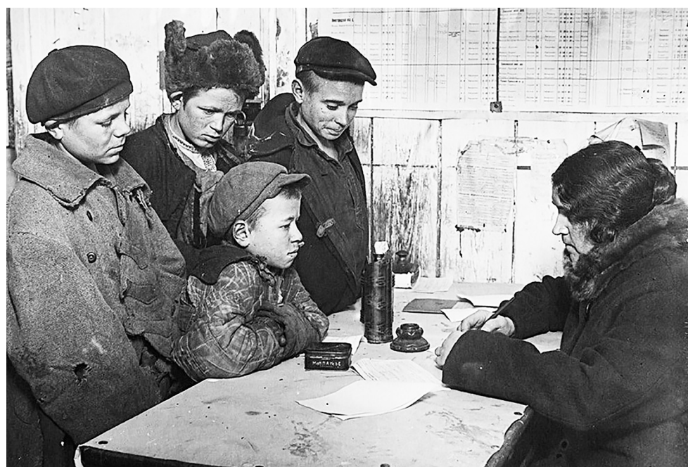
Регистрация бродяжничающих детей в дежурной комнате для беспризорных Московского отдела народного образования, 1928 год.