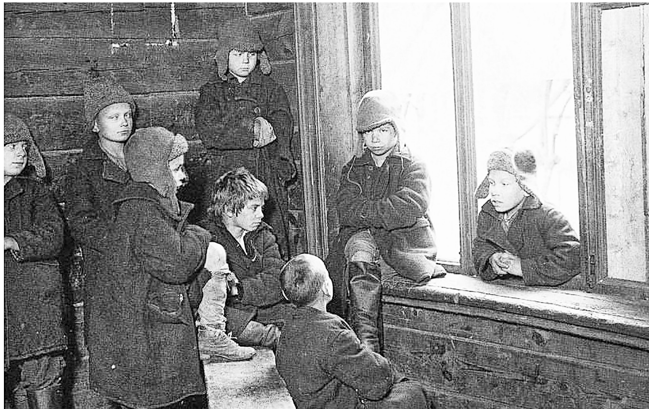
Ликвидация беспризорности, как считала Надежда Крупская, – это не вопрос благотворительности, а вопрос здоровья всего общественного организма.

Больше века в России остаётся неизменной ключевая роль комиссии по защите прав детей. Погрузимся в историю, чтобы узнать, как работала эта система в XX веке. После – поговорим с председателем комиссии по делам несовершеннолетних и защите их прав в Нижнетавдинском районе.