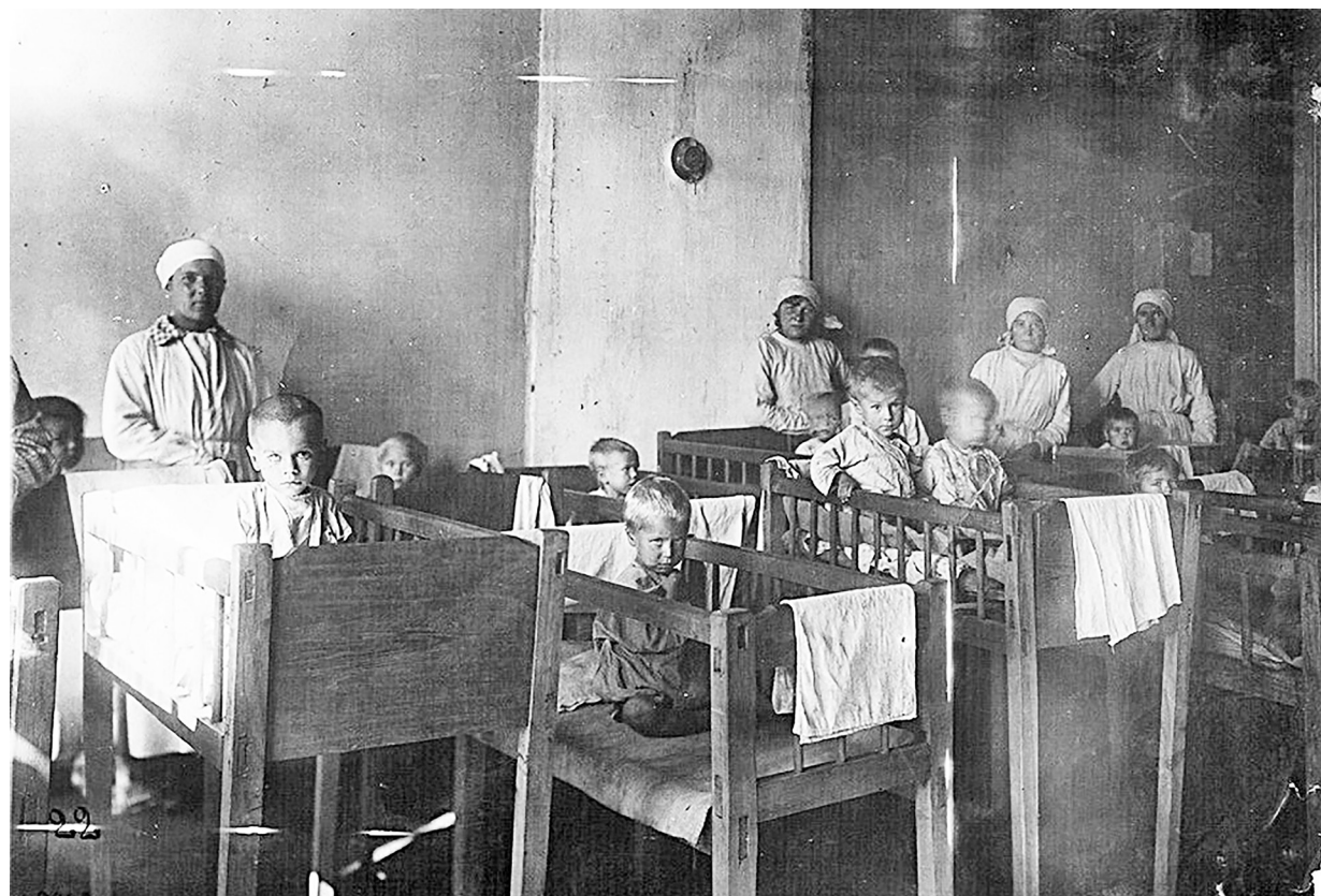
Помощь голодающим Поволжья. Сироты в детском доме Ставрополя. Их родители умерли от голода. 1922 год.