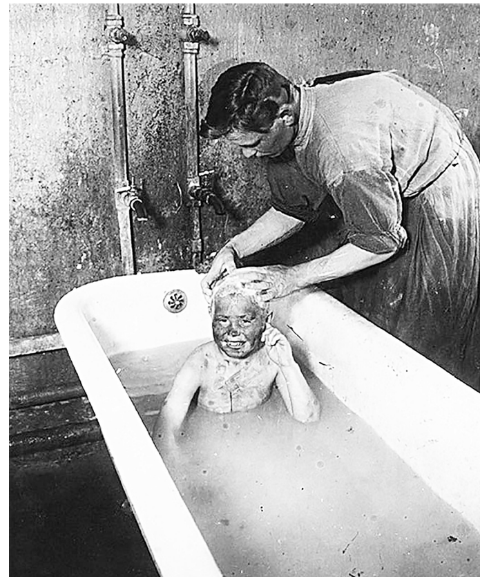
Купание беспризорного мальчика в Покровском приёмнике. Москва, 1925 год.