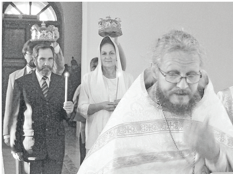
Таинство Венчания в Храме Святой Троицы в Нижней Тавде, 2008 год

Стал возить детей сначала в Нижнюю Тавду в приход Святой Троицы, потом в новый храм.