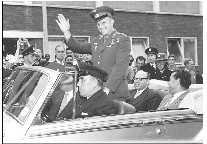
◆ Лётчик-космонавт, Герой Советского Союза Юрий Гагарин.

— 12 апреля для меня дата знаменательная, потому что Юрий Алексеевич Гагарин — Герой на-