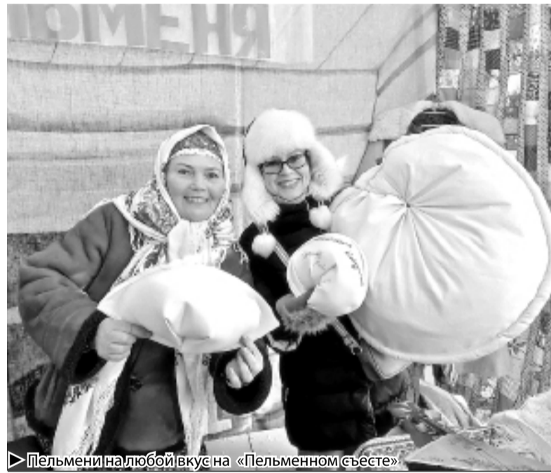
► Пельмени на любой вкус на «Пельменном съесте»

– Но подгорная часть сейчас – объект особого внимания. В первую очередь из-за своего огромного туристического потенциала. Мы сразу определили для