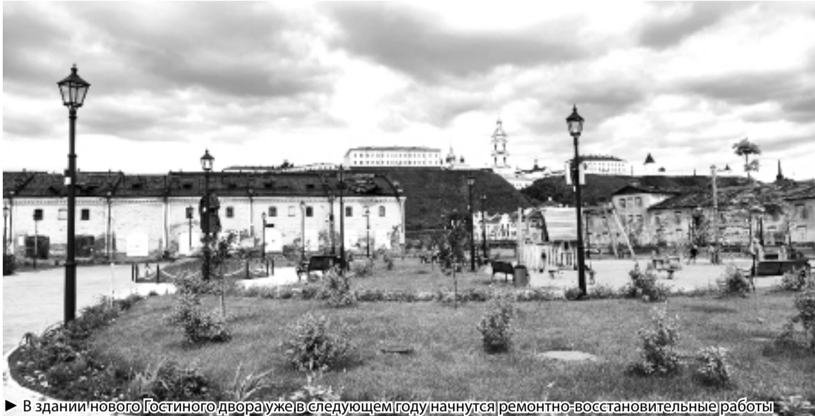
► В здании нового Гостиного двора уже в следующем году начнутся ремонтно-восстановительные работы