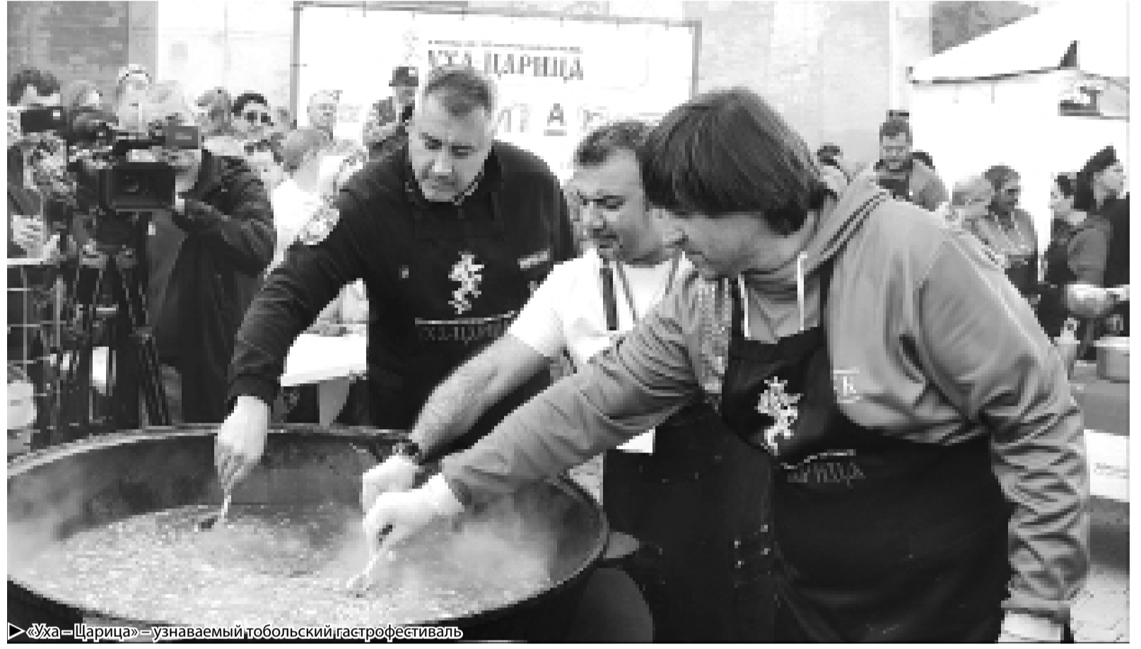
► «Уха-Царица» – узнаваемый тобольский гастрофестиваль