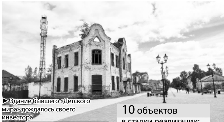
► Здание бывшего «Детского мира» дождалось своего инвестора

борной речи в 2019 году я лишь упоминал про ОКН. Тогда было сложно реально оценить масштабы проблем, способы их решения и ресурсы, которыми мы обладаем. За эти пять лет мы провели огромную работу, в том числе кабинетную, которая на первый взгляд незаметна, и кажется, что ничего не делается. Первое – консервация. Всё, что находилось в критическом состоянии, сейчас в относительном порядке. Второе –