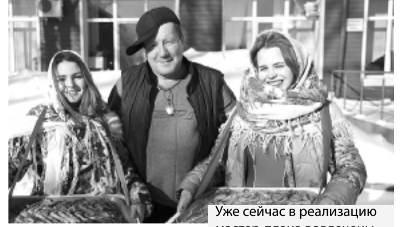
Уже сейчас в реализацию мастер-плана вовлечены

В Tobolsk сегодня открываются новые отели, рестораны, кафе и объекты турпоказа, повышается уровень работы открытых ранее предприятий общественного питания, гостиниц и хостелов. В последние годы родились и стали популярными гастрофестивали «Пельменный съест» и «Положенная порция кофе». А большой фестиваль «Тобольский марафон» уже включён в общенациональный календарь соревнований РФ. Сформировано комфортное транспортное сообщение городского общественного транспорта с аэропортом и ж/д вокза-