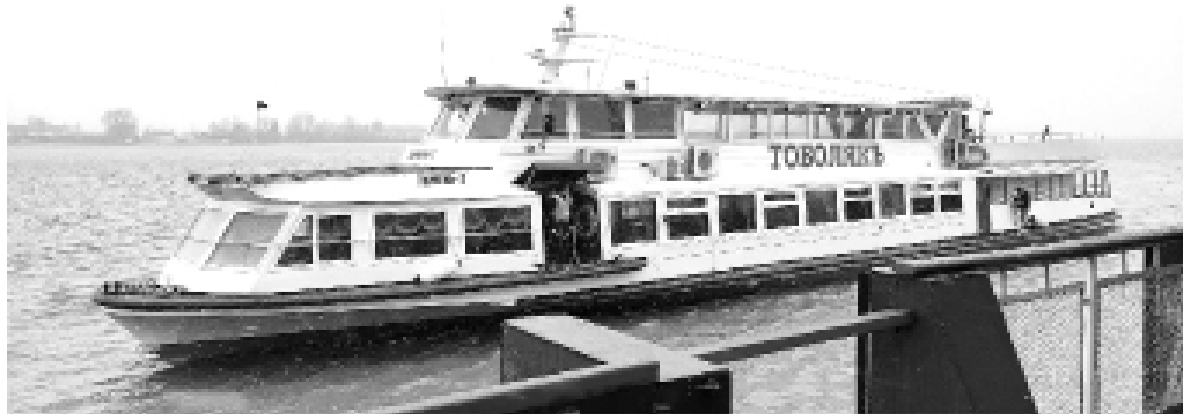
► В Tobolsk вновь появились речные экскурсии

Подгорная часть сейчас – объект особого внимания. В первую очередь из-за своего огромного туристического потенциала. Мы сразу определили для себя, что просто восстановить объекты культурного наследия – мало. Цель – наполнить их жизнью и не дать «умереть» второй раз. Хороший пример этого – восстановление в 2020 году здания богадельни при утраченной Богоявленской церкви у подножия Прямского взвоза