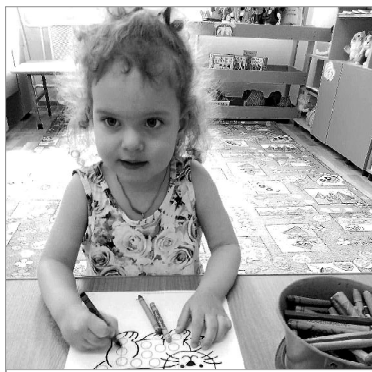
«Рисую» письмо папе»