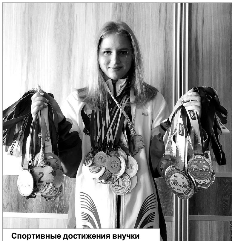
Спортивные достижения внучки