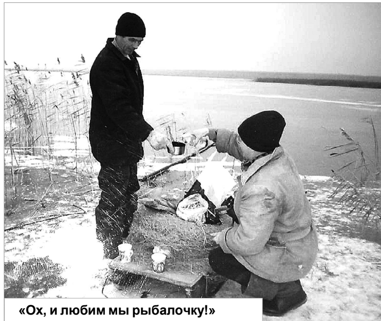
«Ох, и любим мы рыбалочку!»