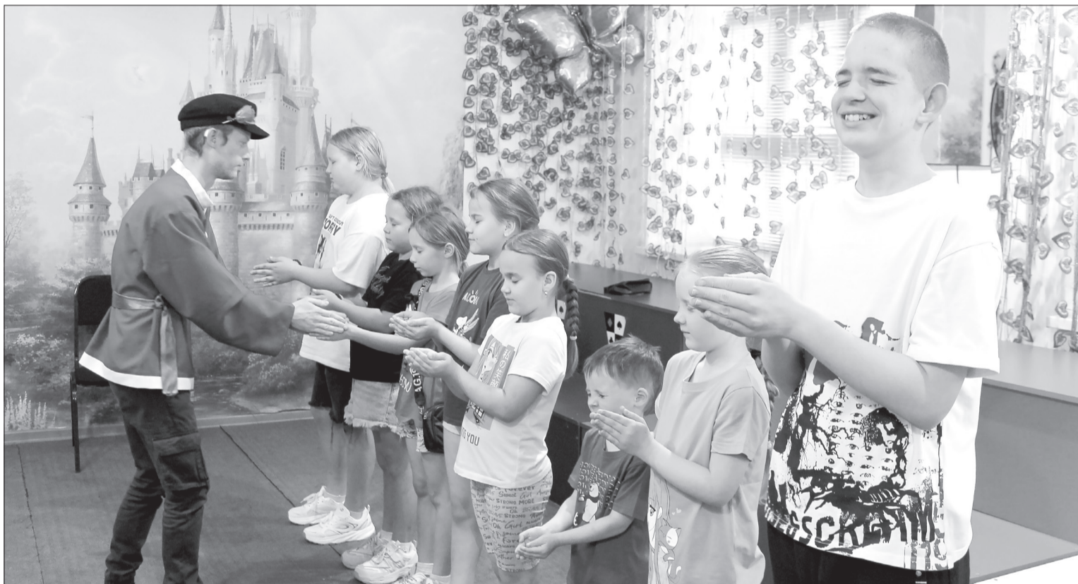
В программе площадки по месту жительства - игровые, познавательные и развивающие занятия

Что предлагает досуговая площадка в Год единства народов России