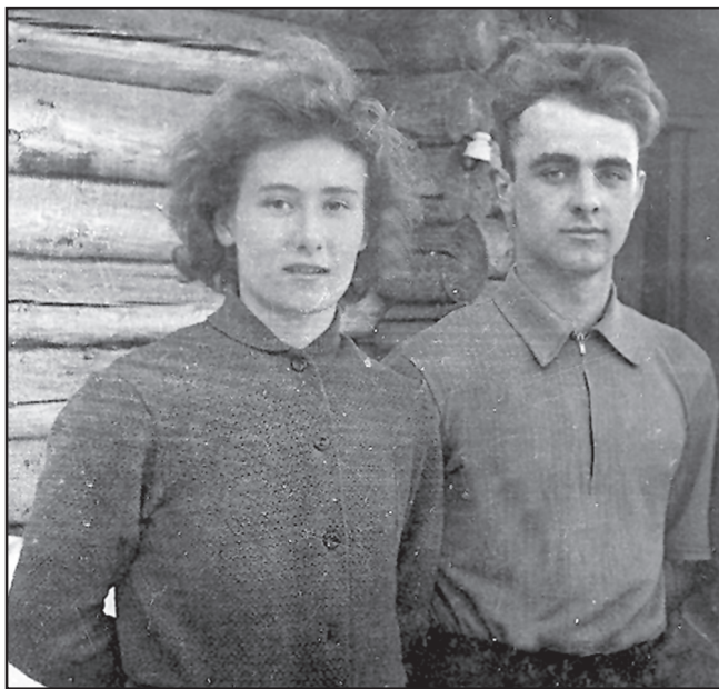
Супруги Мартын в юные годы

– Фамилия? – спрашивали, как на допросе. Недовольно морщились, увидев сложное или по какой-то причине не понравившееся отчество. «Дело» заведено на