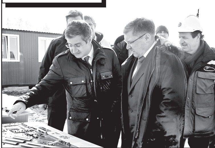
Губернатор Тюменской области В.В. Якушев оценил ход строительства молочно-товарного комплекса

факторы. Сегодня такая позиция не принимается.