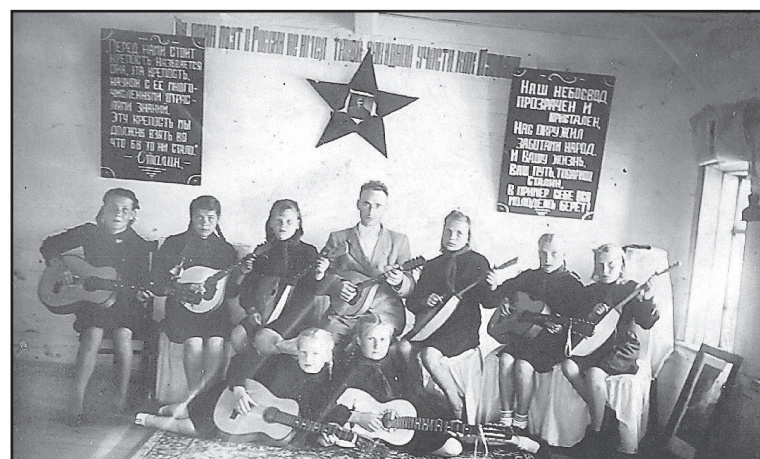
Инструментальный ансамбль Ленинградского детского дома в Бушуево

– Он там, – он указывал за ближайший колок на запад. И не мог объяснить ни детям, ни даже себе, почему им не полагалось жить в родине.