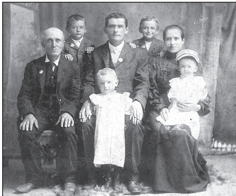
Семья Шульц: дед с женой и детьми

Постановление Совнаркома от 26 августа 1941 года было пространно (на шести листах) и вместе с тем предельно конкретно: «Переселить всех немцев из республики немцев Поволжья в Красноярский край – 70000