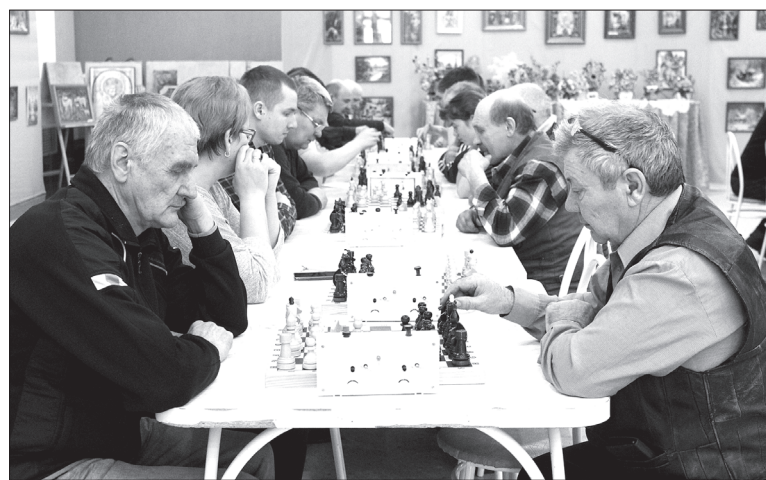
В интеллектуальном виде спорта выявить сильнейших непросто

– В своё время коллектив Областной больницы № 22 часто принимал участие в играх, практически каждый год представляли команду, хотя бы три вида спорта «закрывали». Затем несколько лет был перерыв. Нынче возобновили традицию, заявили на участие в лыжных гонках, шахматах, городках, теннисе и волейболе. Надеемся занять призовое место.