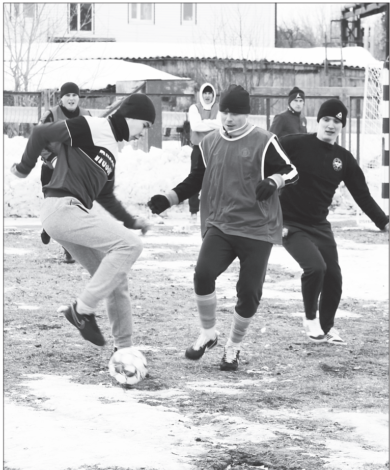
На площадке по мини-футболу было жарко

По информации ДЮСШ «Кристалл» Татьяна АГАПИТОВА