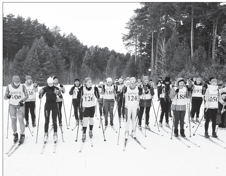
Самый зимний вид спорта – лыжные гонки