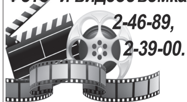
ФОТО НА ДОКУМЕНТЫ. ФОТОПРОГУЛКИ. РЕТУШИРОВАНИЕ ФОТОГРАФИЙ. МОНТАЖ ВИДЕОРОЛИКОВ. Профессиональное оборудование, творческий подход, низкие цены.