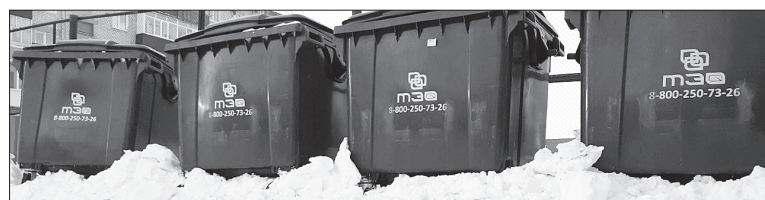
Некачественная уборка территории – одна из причин опоздания мусоровоза