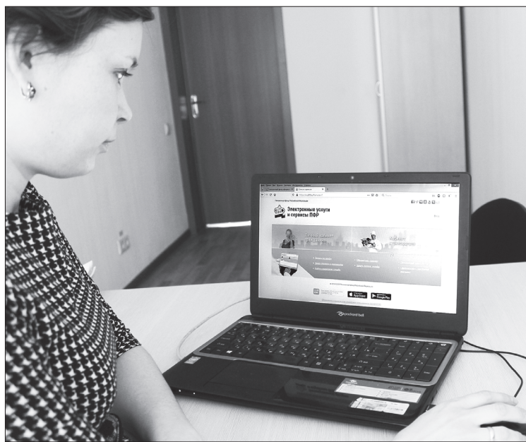
Большую часть услуг можно получить в электронном виде