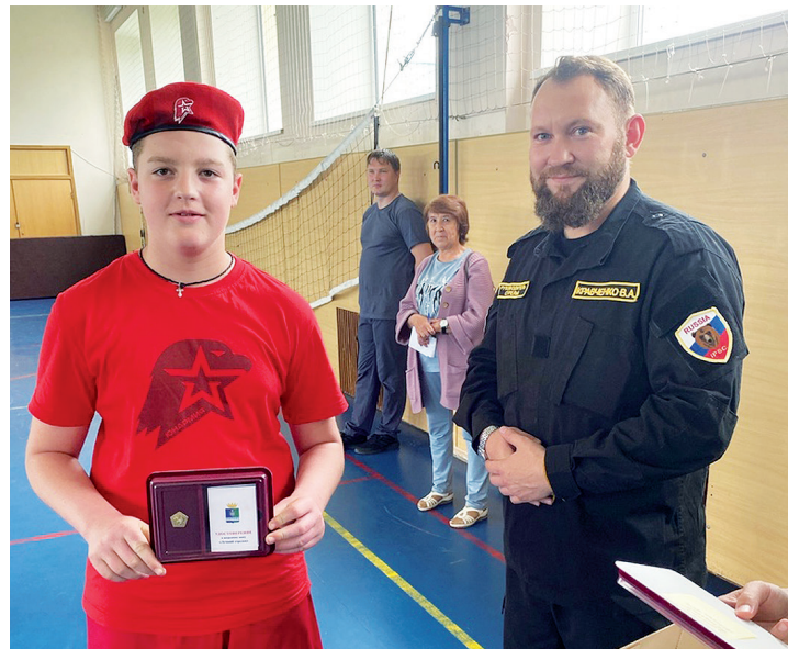
Фото Прииртышской школы

С 2016 года ведёт свою работу Всероссийское детско-юношеское военно-патриотическое общественное движение «Юнармия».