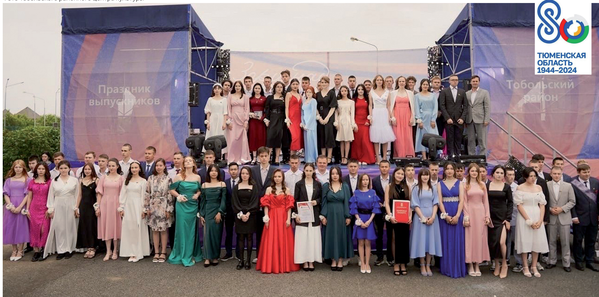
Фото Тобольского районного центра культуры