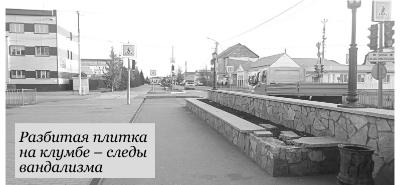
Разбитая плитка на клумбе – следы вандализма