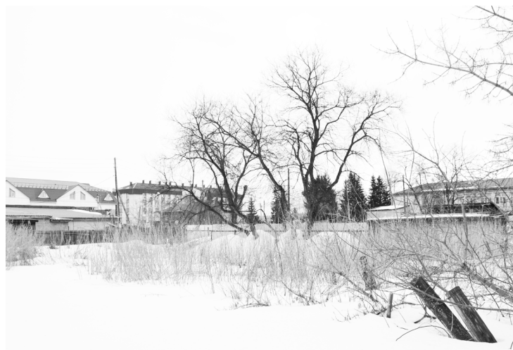
Пейзаж за окнами жителей многоквартирного дома пока не радует.