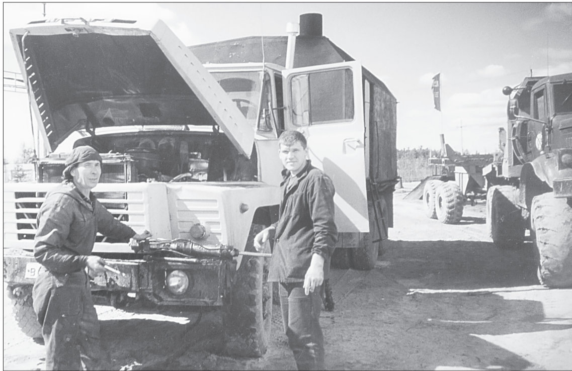
Профессия моториста на Севере очень ценилась, ведь до цивилизации не близко, а техника имеет свойство ломаться

Приказ по Тобольскому МССМУ-1 треста «Сибпромэкскавация» гласил: «Направить машинистов бульдозера шестого разряда в г. Обухово Киевской области, на Чернобыльскую АЭС, сроком на один ме-