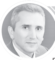
Александр МООР губернатор Тюменской области

- Президент посмотрел весь жизненный путь человека и сделал акцент на меры поддержки на каждом этапе: поддержка, связанная с рождением детей, помощь беременным женщинам, которые находятся в трудной жизненной ситуации, семьям с детьми от рождения до трех лет, от трех до семи и от восьми до 16 лет, если они воспитываются одним родителем. Озвучивались огромные проекты, которые связаны с развитием экономики. На что бы я хотел обратить внимание - это ускоренное строительство трассы от Москвы до Екатеринбурга, за три года фактически. Можно сказать, что от Екатеринбурга до Тюмени трасса уже строится и тоже к 2024 году должна расширяться. Поэтому через четыре года Тюмень свяжется с Москвой и Санкт-Петербургом новой, современной, безопасной дорогой, и это, конечно, хорошая новость для развития экономики, развития туризма.