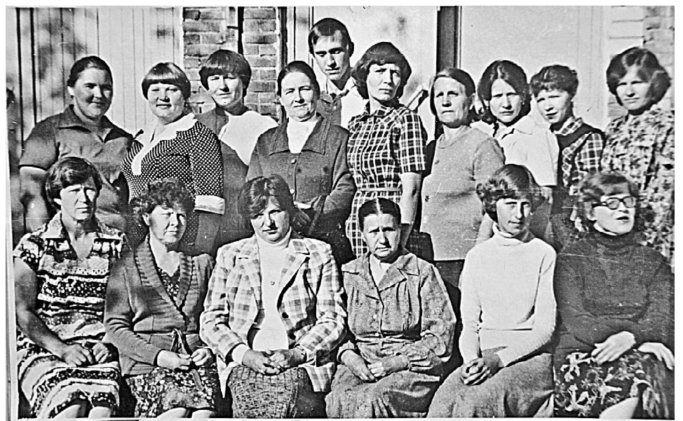
➤ Коллектив коррекционной школы