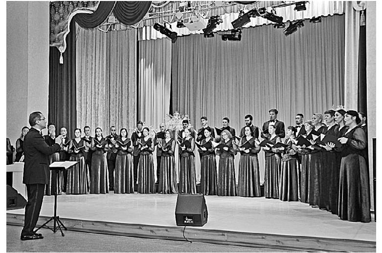
➤ Капелла Тюменской филармонии