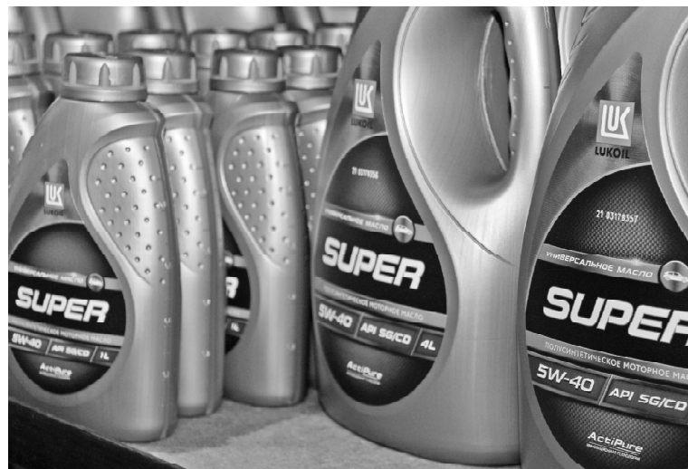
➤ Всё для авто