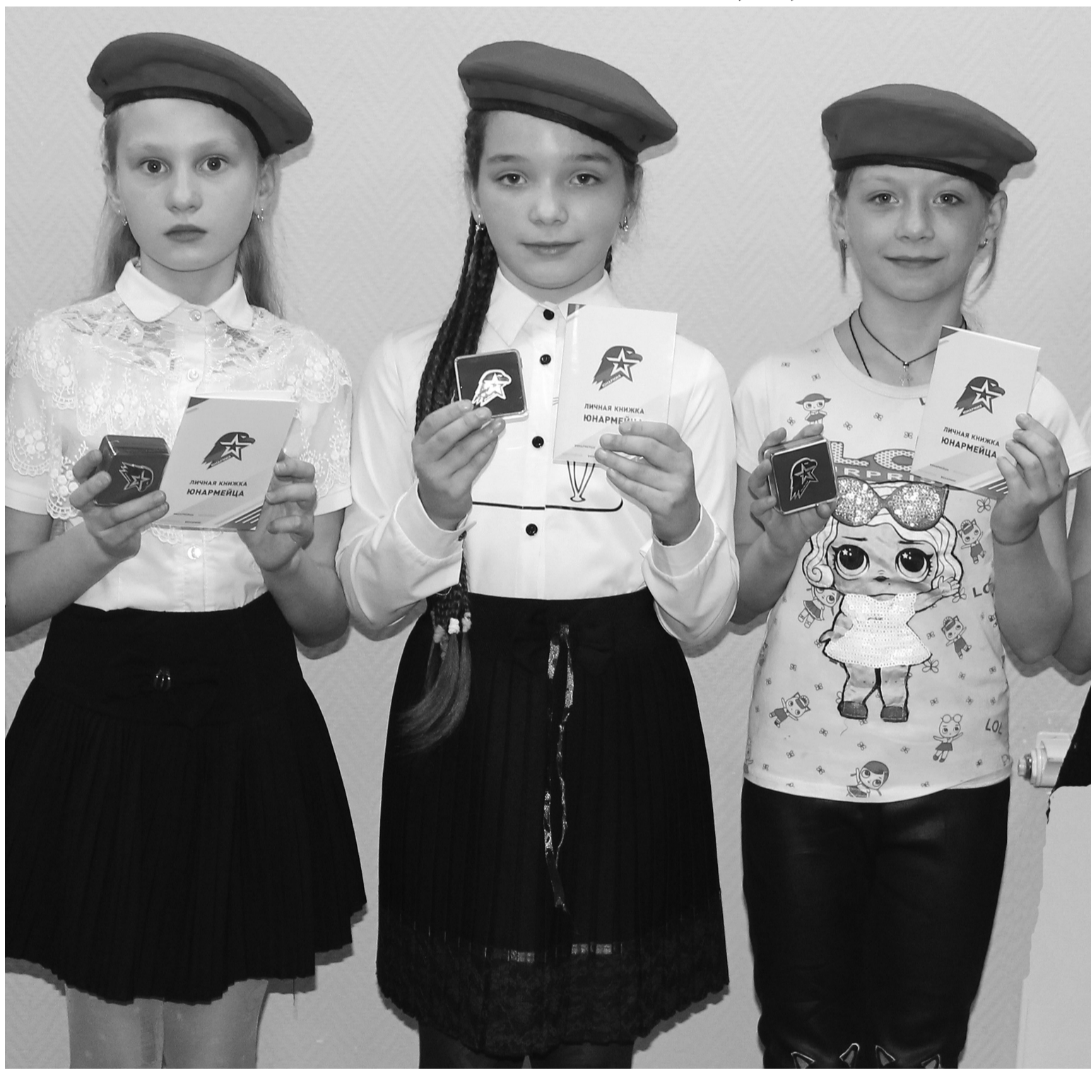
Порядка сорока школьников района пополнили ряды юнармейцев

проектах они могут себя реализовать. Не обошлось и без практических занятий. Так, в конце вечера второго дня ребята занимались проектной деятельностью, пробовали себя в роли инициаторов, в небольших проектах.