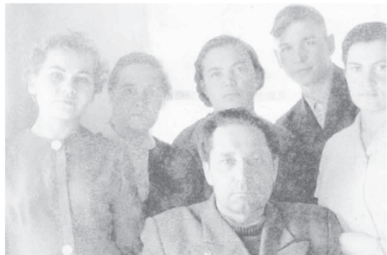
Коллектив исетской санэпидстанции. Февраль, 1964 г.