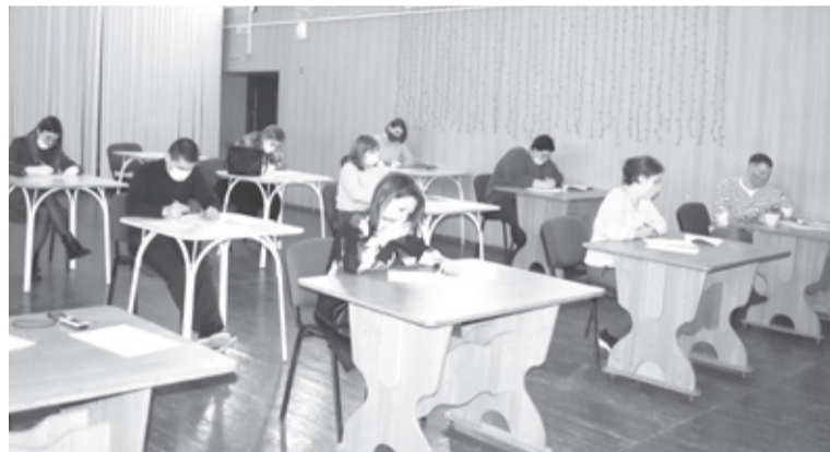
Молодёжный центр стал одной из площадок экологического диктанта.