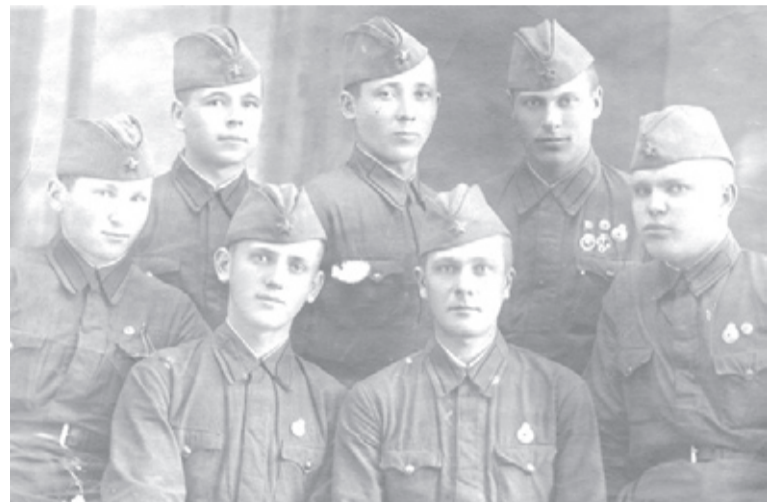
Солдаты-курсанты 22 школы санинструкторов Красной Армии. Май, 1941 г.