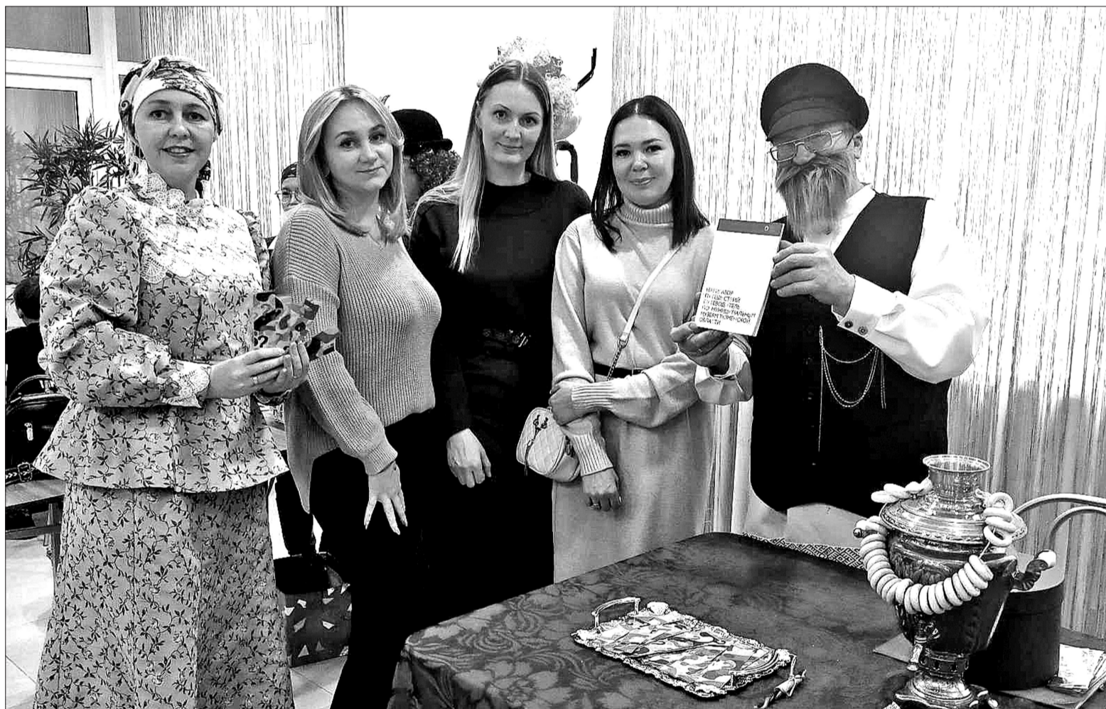
☞ Сотрудники краеведческого музея и библиотечного центра приглашают земляков познакомиться с интересным изданием «Навигатор путешествий: путеводитель по муниципальным музеям Тюменской области».

Презентация книги. Заводоуковцы познакомились со сборником «Навигатор путешествий: путеводитель по муниципальным музеям Тюменской области»