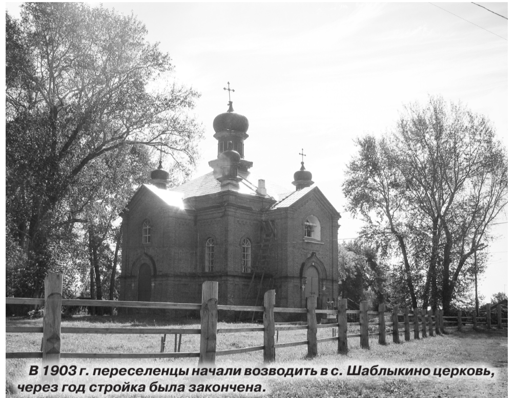
В 1903 г. переселенцы начали возводить в с. Шаблыкино церковь, через год стройка была закончена.

Большую помощь в работе с населением оказывает со-