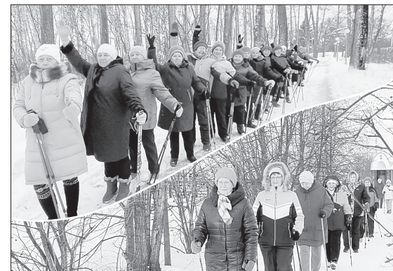
Участники проекта занимались на двух площадках - в парке Победы и парке им. Александра Кауля

Завершается ещё один крупный проект АНО «Пристань добрых дел» - «Северная ходьба», реализованный при поддержке администрации Ялуторовска.