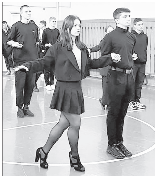
Классическим танцам ребят обучали прямо в школах