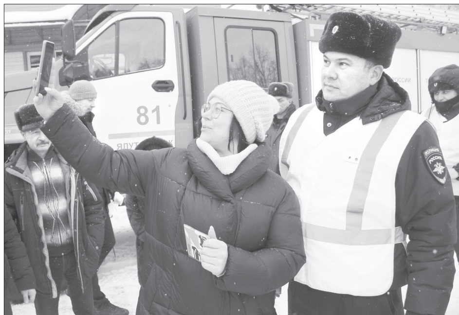
Все желающие могли сделать селфи с автоинспектором

единялась к остальным. Медики тут же на месте умудрились оказать реальную помощь водителю с порезом пальца, обработав и перебинтовав его.