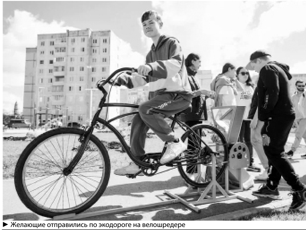
► Желающие отправились по экодороге на велощредере