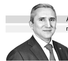
АЛЕКСАНДР МООР губернатор Тюменской области