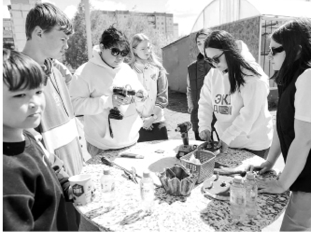
► Экоактивисты вышли в люди

– В нашем экодоме работают мастерская ресайклинга (вы уже познакомились с велощредером), игротка, эколбиблиотека, пункт приёма вторсырья,