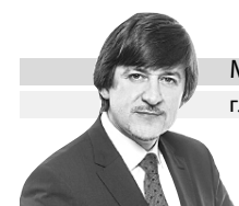
МАКСИМ АФАНАСЬЕВ глава города Тобольска

Пусть ваши сердца всегда будут полны света и добра, а вместе с праздником в ваши дома войдут здоровье и радость, счастье и любовь, достаток и благополучие. Пусть ваши молитвы будут услышаны, а ваш путь всегда озаряет яркое солнце надежды. Тепла и гармонии вашим семьям!