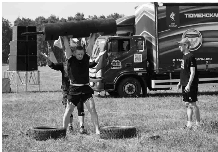
Вес бревна от 80 до 100 килограммов