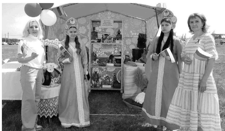
На колоритной площадке Омутинского агропедколледжа можно было ознакомиться с выставкой народных ремесел и промыслов России

Со сцены огласили результаты районной военно-спортивной игры «Сыны Отечества» среди представителей силовых структур и ветеранов боевых действий. Участие принимали команды