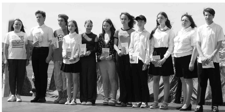
Всероссийская акция «Мы - граждане России» помогает сделать получение паспорта незабываемым событием

ветеранов СВО, отдела полиции, пожарной охраны и росгвардейцы.