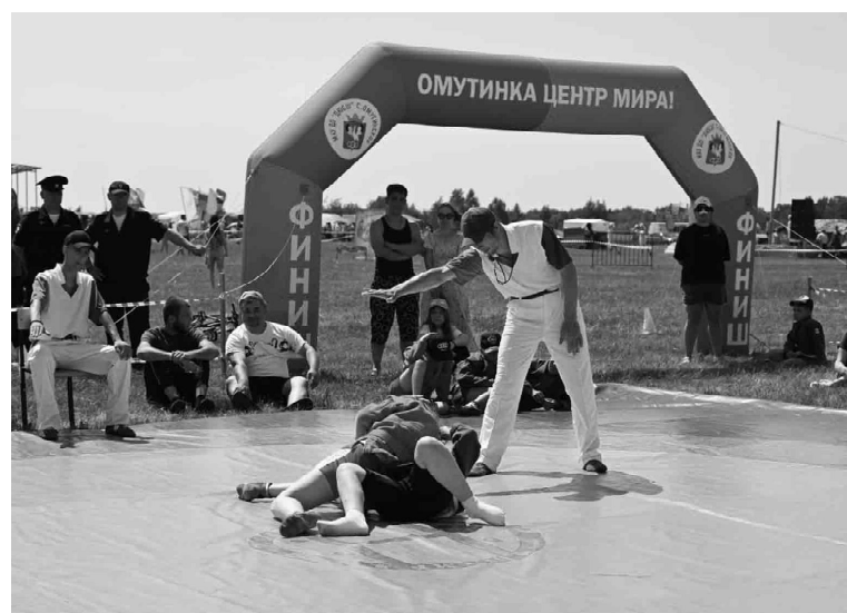
Зрители поддерживали спортсменов, переживали за своих воспитанников тренеры, что создавало атмосферу, наполненную адреналином и волнением