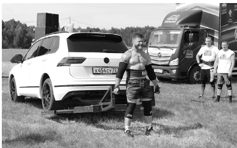
По словам атлетов, чтобы поднять автомобиль, нужно иметь сильные ноги