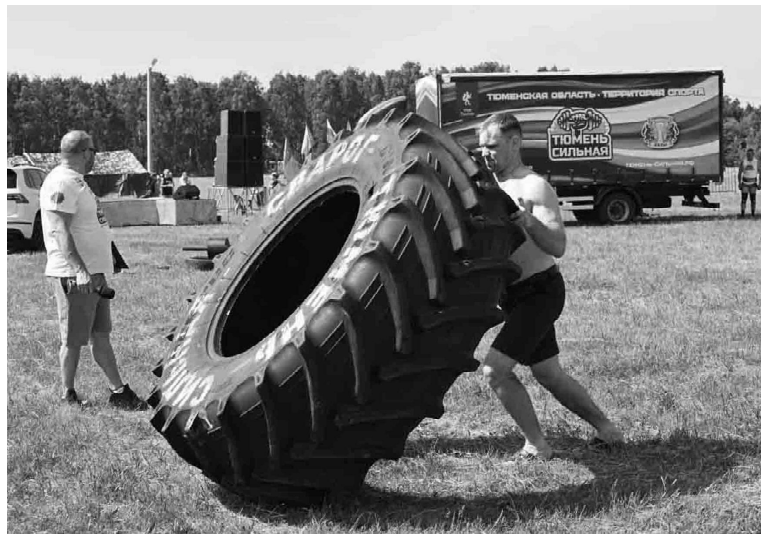
Анатолий Винник перевернул огромную автошину три раза