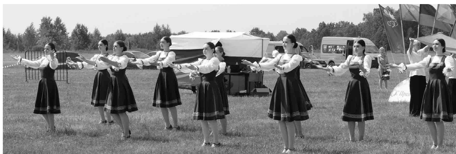
На главной сцене образцовый ансамбль эстрадного танца «Мы молодые» порадовал зрителей яркими номерами

Особый противопожарный режим на территории Тюменской области продлен до 25 июня. Такое решение было принято из-за повышения рисков возникновения лесных пожаров по причине неосторожного обращения с огнем. В период действия особого противопожарного режима запрещается: