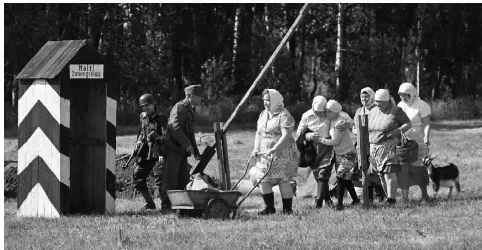
Немецкие солдаты гонят мирных жителей на пропускной пункт для отправки в Германию