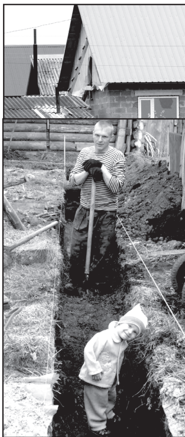
Строим дом всей семьёй