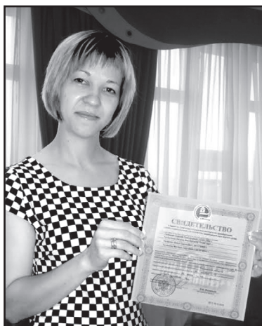
Долгожданное свидетельство участника программы