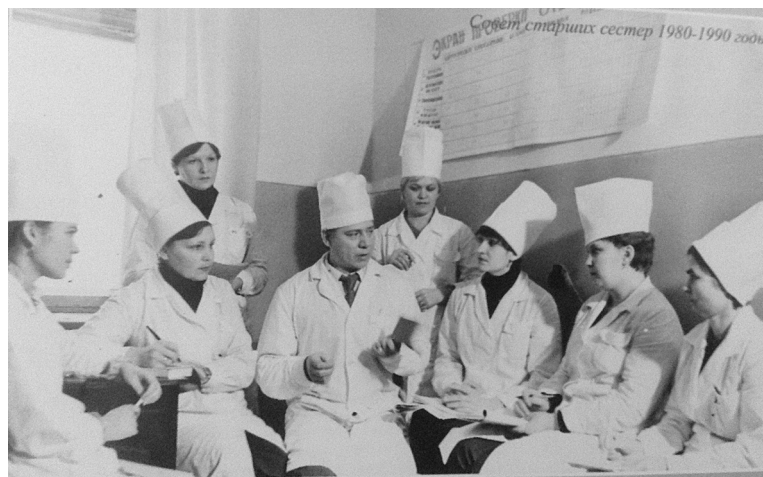
Совет старших сестёр. 1980-1990гг.