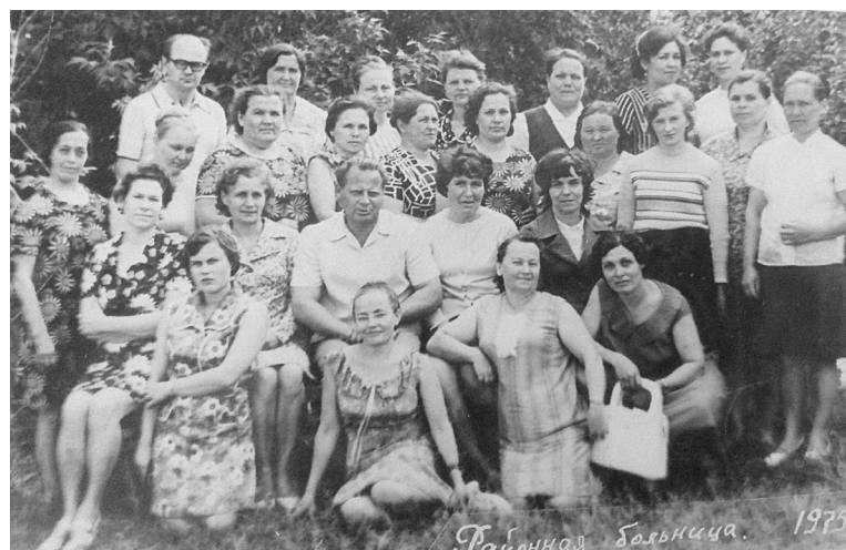
Коллектив районной больницы. 1975г.