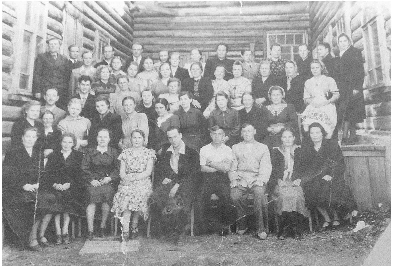
Фото 1950-1960 гг.

– Помню больницу с 1958 года. Роддом, инфекционное отделение, физиокабинет находились в одном здании, только входы были разными. В основной больнице (мы её называли общим отделением) находились детские, гинекологические, терапевтические, хирургические палаты. Комната в 12 метров была приёмной, где делали перевязки, спасали больных,