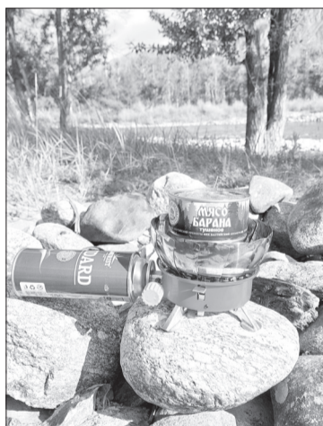
Приготовление еды на газовой горелке удобно и безопасно в отличие от костра