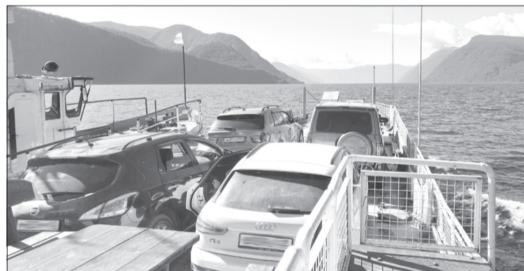
Ни одна автобусная экскурсия не сравнится с путешествием на пароме через Телецкое озеро. Расстояние между берегами составляет 70 километров. За 6 часов пути можно насладиться красивыми видами гор и увидеть множество водопадов