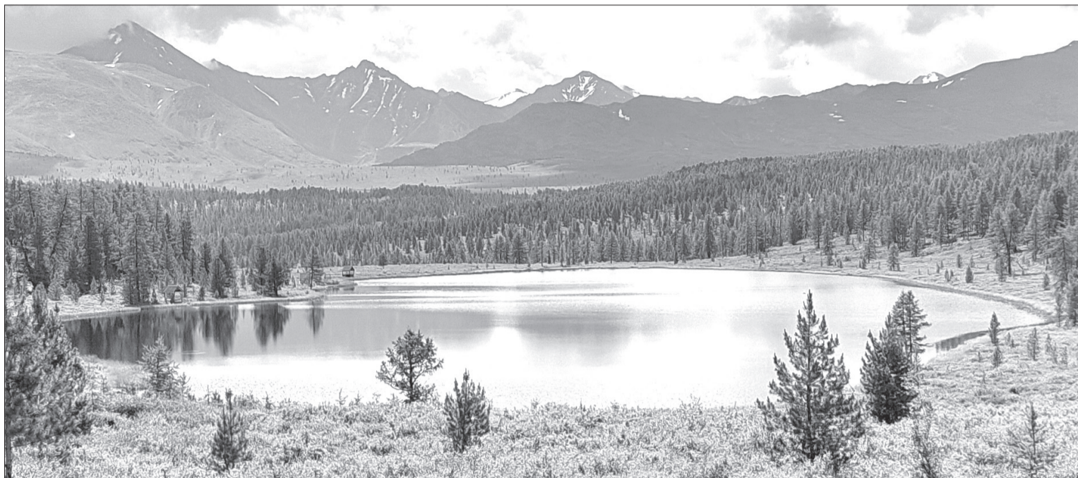
Высокогорное озеро Киделю - одно из самых живописных на Алтае. За ним видны вершины Курайского хребта со снежными шапками