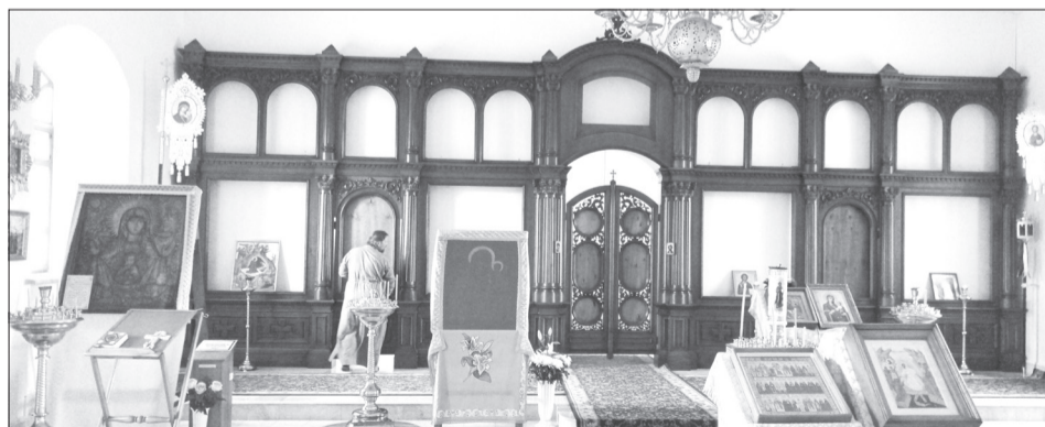
Временный иконостас в нижнем приделе уже заменили постоянным

Его изготовили в Тобольской иконописно-реставрационной мастерской имени святого Иоанна Тобольского. Первый ряд киотов займут большие иконы, написанные в мастерской на средства благотворителей. По обе стороны Царских врат разместят образы Христа Спасителя и Пресвятой Богородицы, а по бокам от них - ряд икон месточтимых святых. Второй (верхний)