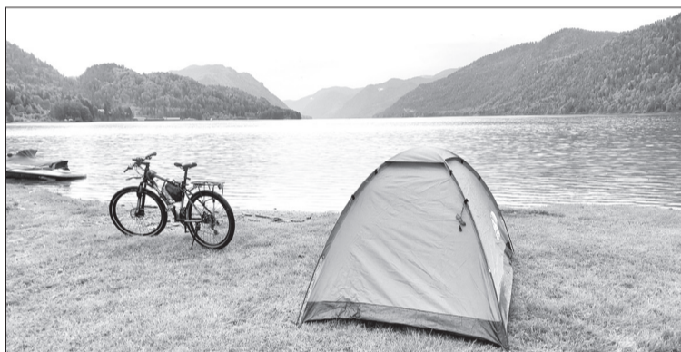
Ночевать в палатке интересно и комфортно, если это отдых на природе. При больших физических нагрузках лучше снять домик