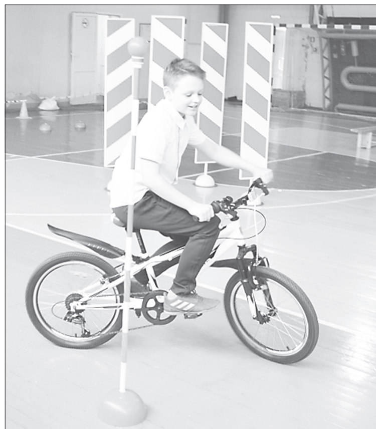
Вместо авто у ребят велосипед, но ездят они по тем же фигурам, что и на взрослом экзамене

Абсолютным лидером признали команду ЦТиДТ. Вместе с ребятами из Памятного они будут защищать честь города и района на областных соревнованиях, которые пройдут 17 мая в Тюмени.