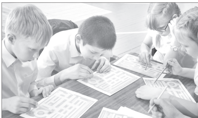
Эти школьники знают ПДД лучше некоторых водителей

Победителем, получившим главный приз – велосипед, стала команда из Памятного. Она