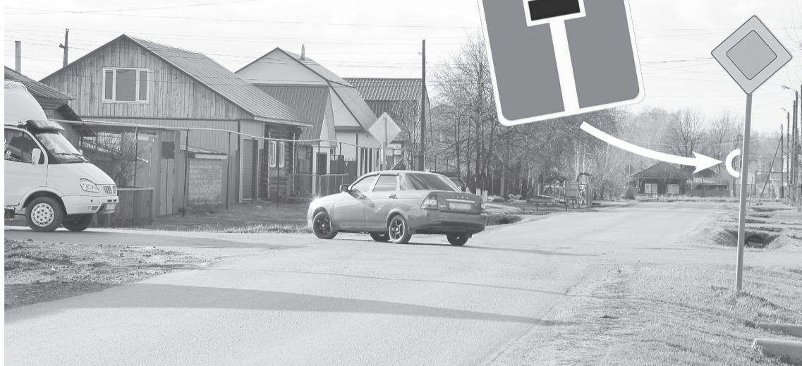
Многие водители удивляются, что тупиковая улица Московская является главной дорогой

Смена приоритетов. Насущный вопрос подняли представители ГИБДД. За последние три года на пересечении улиц Московской и Тюменской произошло восемь ДТП – семь столкновений и один наезд на пешехода. Основной причиной