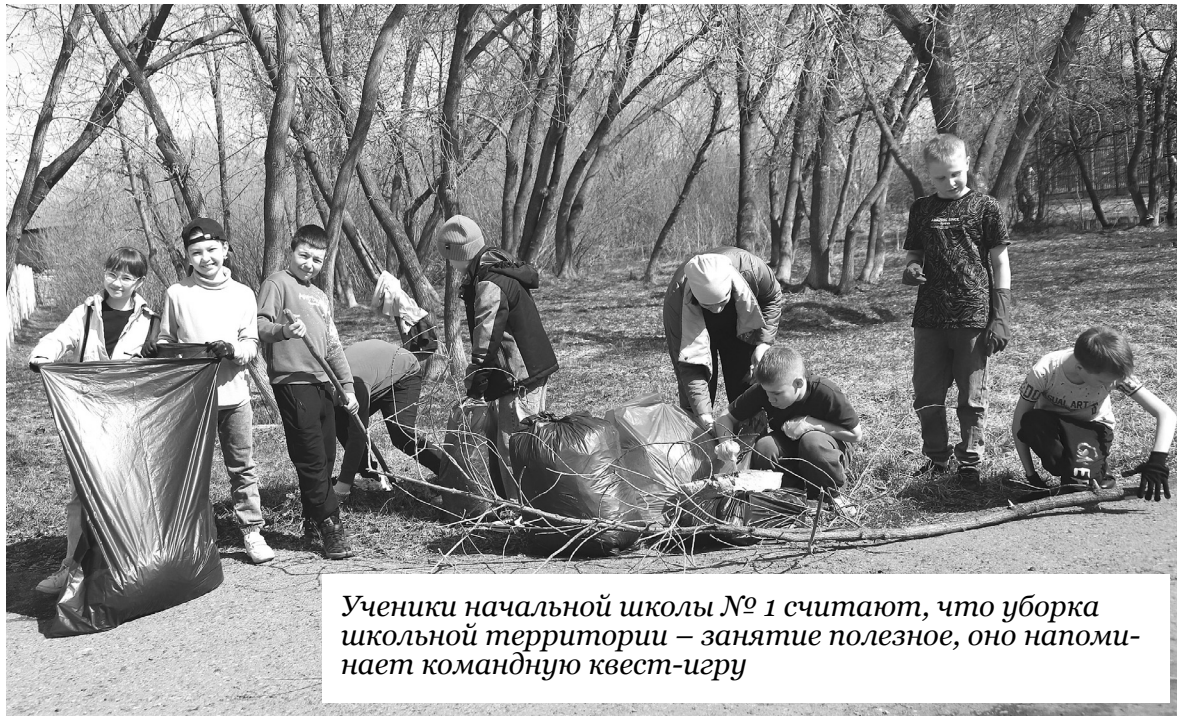
Ученики начальной школы № 1 считают, что уборка школьной территории – занятие полезное, оно напоминает командную квест-игру