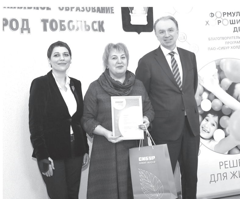
Школа № 5 получила грант на создание планетария