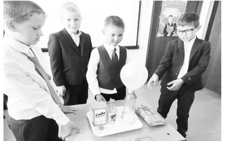
Четвёртый класс исследовал особенности тюменского пищевого производства.