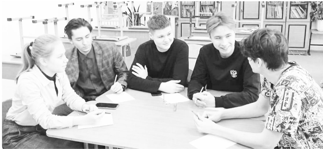
Старшеклассники увлечённо обсуждают научные темы.