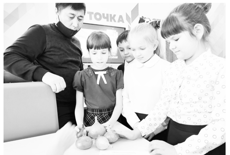
Третьеклассники определяли самый урожайный сорт лука.