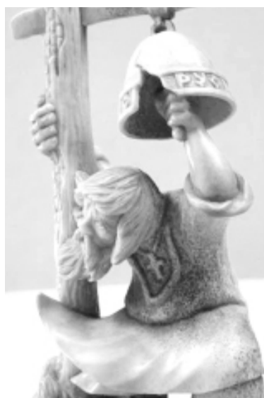
Закон набата

Каждая из 24 представленных на выставке работ заслуживает особого внимания и в компози-