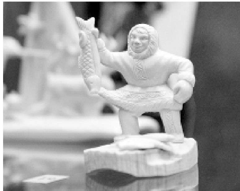
Обращение к традиционным промыслам народов Севера