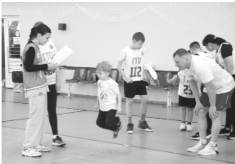
Один из этапов – прыжки с места