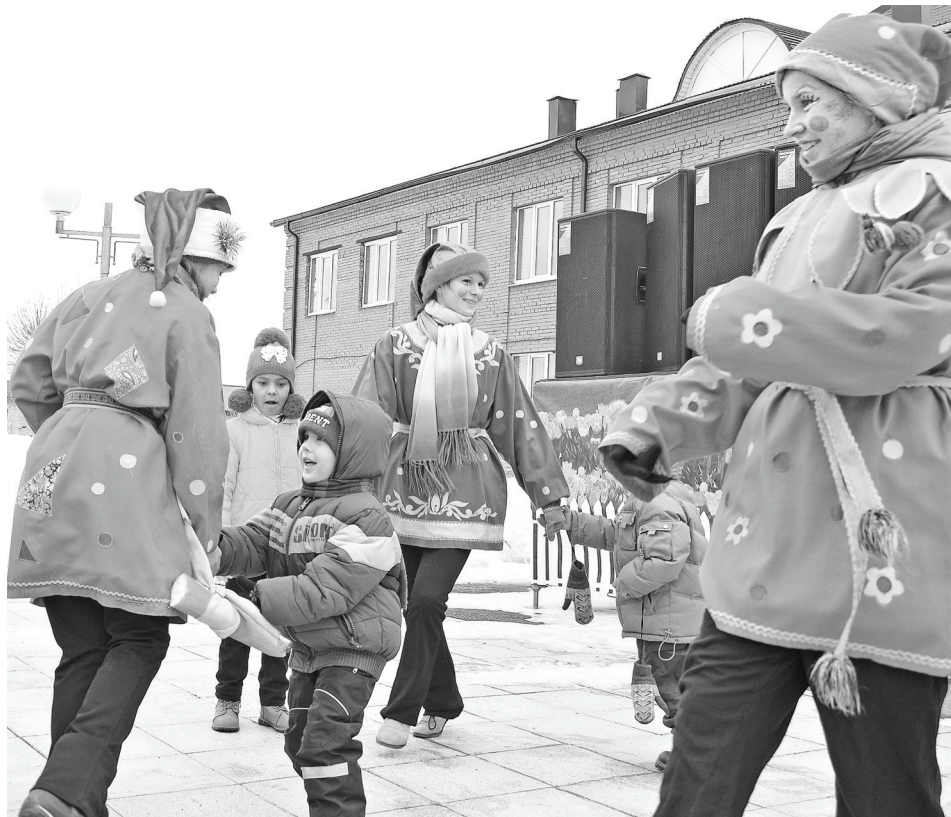
Детвора веселилась от души.

Надежда НАДЕЖДИНА, Михаил ПЕТЕЛИН (фото)