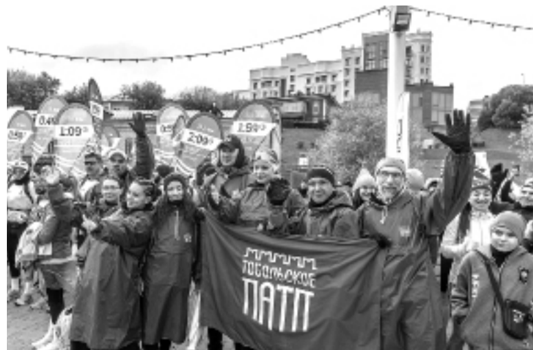
На заботливом предприятии – здоровый коллектив: сотрудники – участники марафона «Врата Сибири»

Главным событием года стало признание Тобольского ПАТП победителем регионального этапа и