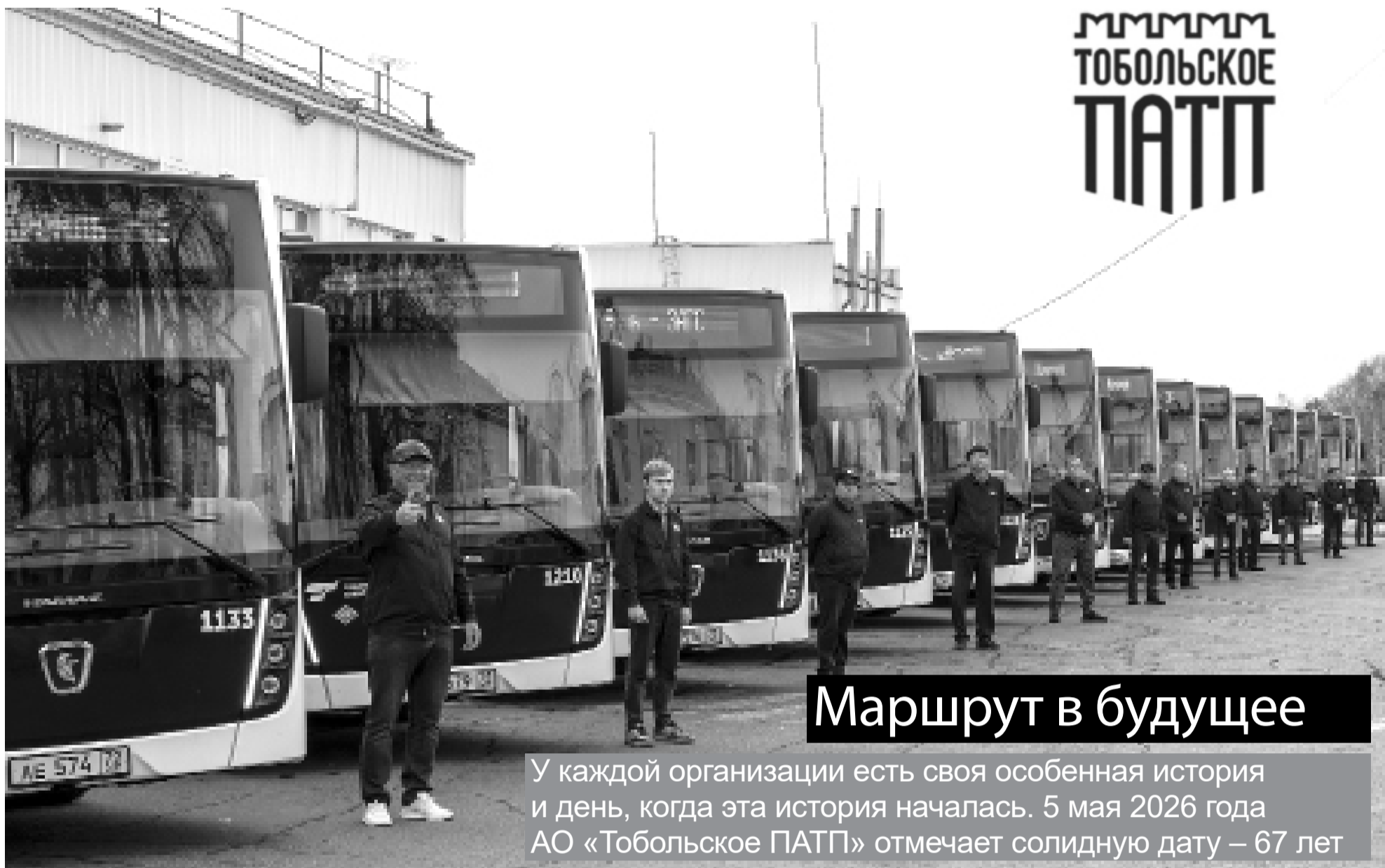
15 «Нефазов» вышли на тобольские маршруты в 2025 году

За это время предприятие прошло путь от автоколонны до цифрового перевозчика. О том, как меняется жизнь пассажиров и сотрудников, – в праздничном номере.