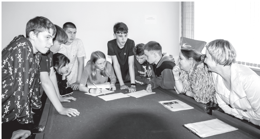
Вместе с любой задачей справимся