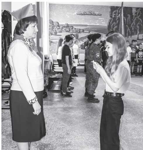
Каждый отряд сдал рапорт