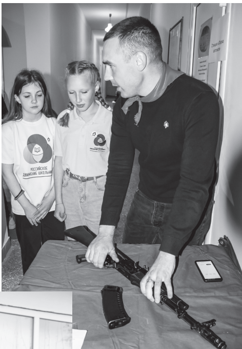
«Зарница» – игра, которая интересна и сегодняшним школьникам