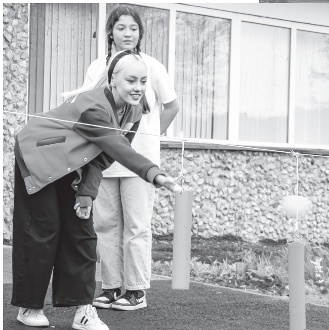
Ребята проходят испытания