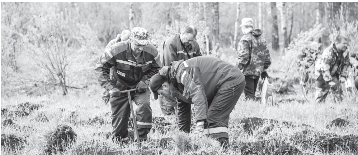
Юринцы высадили сеянцы сосны в память о тех, кто погиб на войне