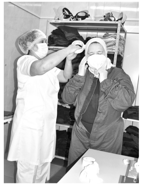
Все детали защитного костюма для надёжности фиксируются скотчем

Каждый работающий здесь верит, что вместе мы сможем победить вирус и вернуться к прежней жизни. Ради этого стоит потерпеть!