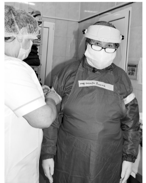
Защитный экран – часть экипировки