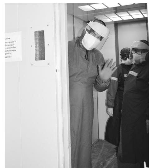
На лифте медперсонал отправляется к месту работы в "красной зоне"