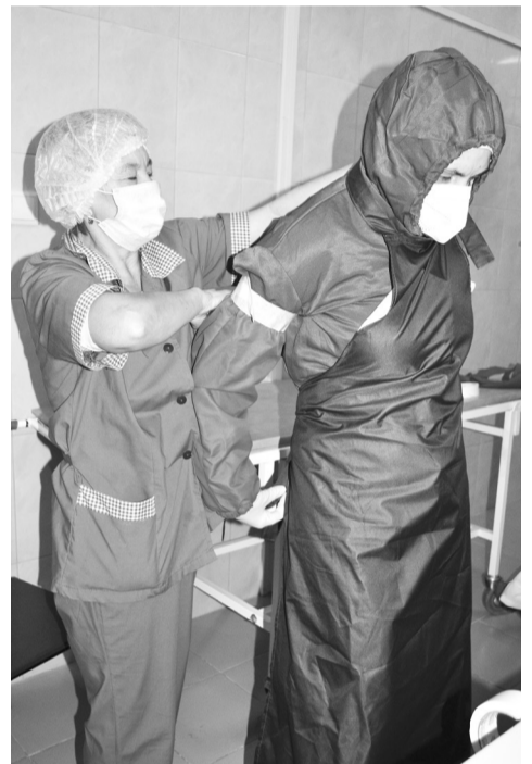
Особая роль отводится помощникам. Они следят за каждой мелочью