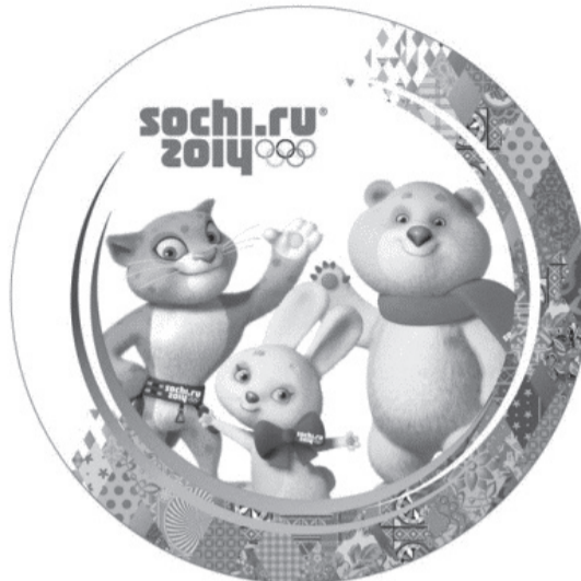
Талисманом игр в Пекине стала панда в ледяном костюме. Символами игр, которые состоялись в Сочи в 2014 году, были Снежный барс, Зайка и Белый мишка