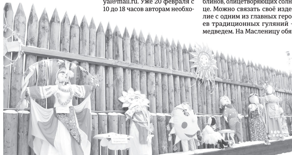
Форма и вид изделия могут быть разнообразными. Основное условие - высота не менее метра

зательно наряжали человека в шубу из меха этого зверя или вывороченный наизнанку тулуп. Тот плясал, подражая движениям просыпающегося косолапого после спячки, а вокруг него водили хоровод. Также в старину на праздник украшали колесо от телеги и на шесте носили его по улицам. На гербе Ялуторовска тоже изображено колесо, только мельничное, но выглядит весьма символично. С гармонью и песнями объезжали несколько раз село на лошадях. Вдоль улиц или с пригорков катали зажжённые колёса. Девушки водили хороводы, ведь они тоже в форме колеса. Конечно же, никуда и без соломенного чучела, олицетворяющего зиму. Но приветствуются и современный креативный подход. В общем идея для творчества огромное множество, главное - проявить свой творческий потенциал и создать символ, который сможет передать атмосферу одного из крупнейших событийных праздников в нашей стране.