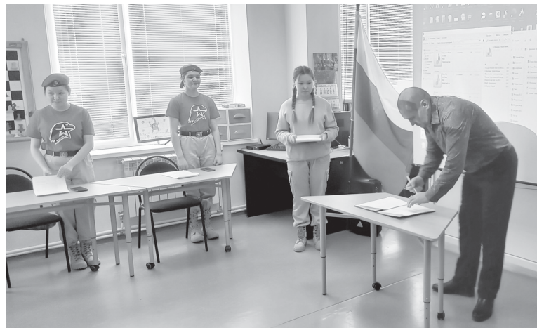
Торжественное подписание заявления о создании первичного отделения РДДМ

Российское движение детей и молодёжи «Движение первых» – это единая структура, в которой множество возможностей для самореализации каждого ребёнка, молодого человека, для воплощения самых смелых идей и инициатив в жизнь. Что ж, в добрый путь, молодёжь, в путь творчества,