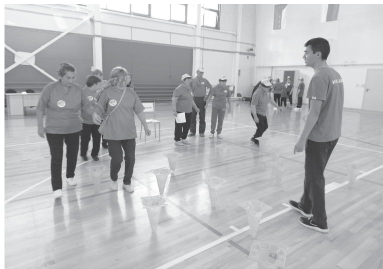
Ветераны принимают активное участие в спортивных мероприятиях

На благотворительный счёт для поддержки семей мобилизованных граждан поступило 269 тысяч руб-