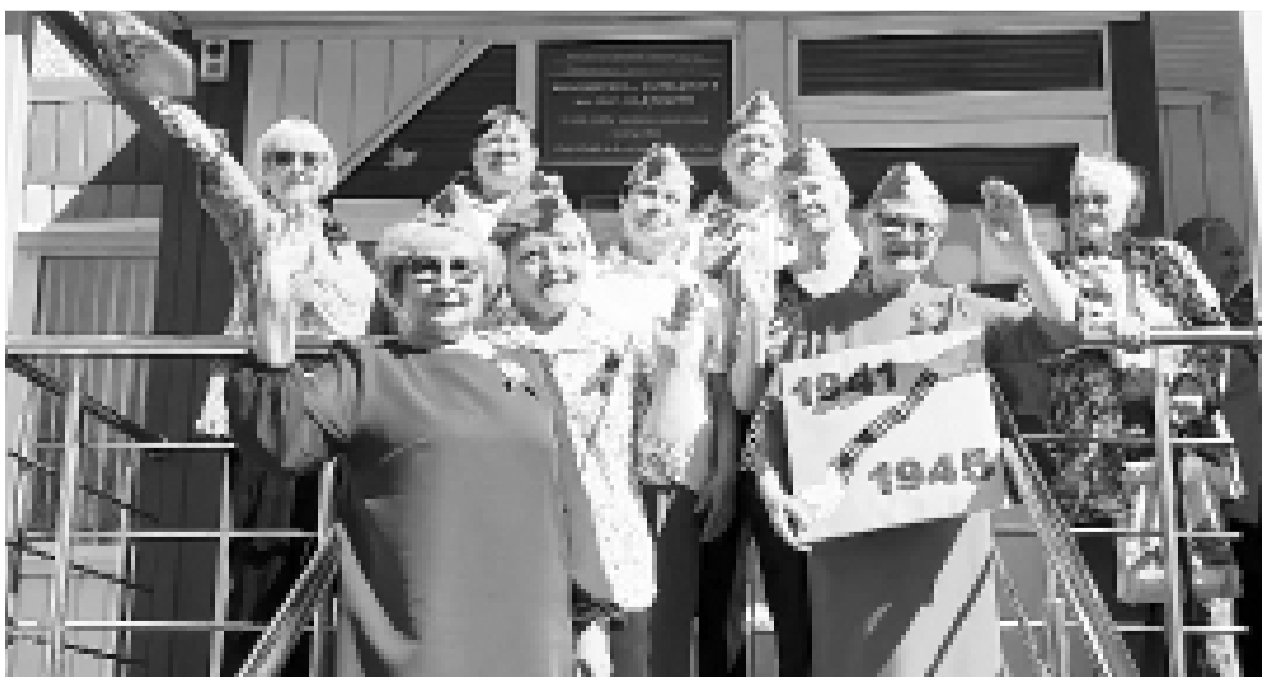
Члены клуба «Интересных встреч»