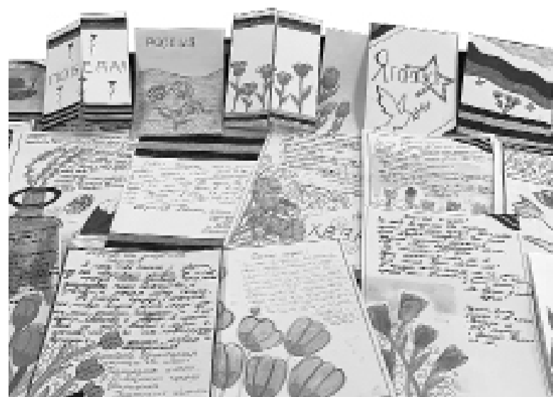
Открытки для участников СВО

Победа Главная, великая Провозглашает, утверждает, мотивирует Торжество правды и жизни Память!