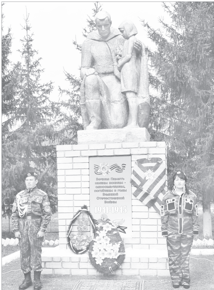
На митинге в д. Яр