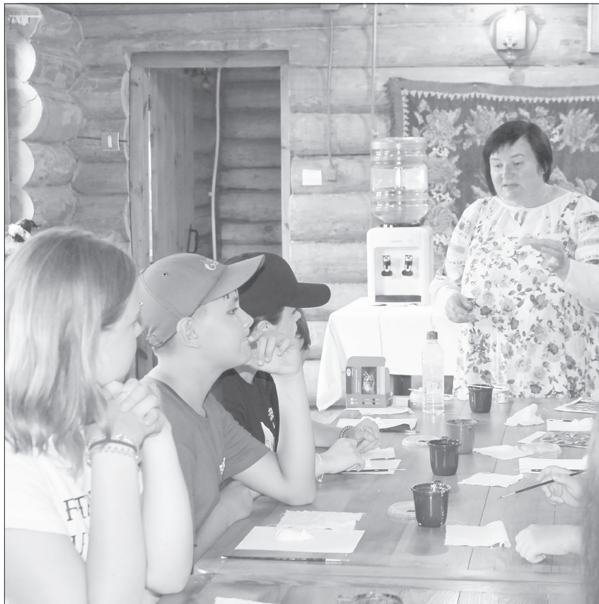
Мастер-класс длится 30 минут. За это время дети успевают сделать небольшую поделку в одной технике

- В июне у нас по списку было сорок детей, а сейчас - семнадцать. Возраст ребят самый разный. Даже трёхлетнего малыша мама приводила. Ему нравилось, он весь месяц у нас занимался. По традиции, завершая