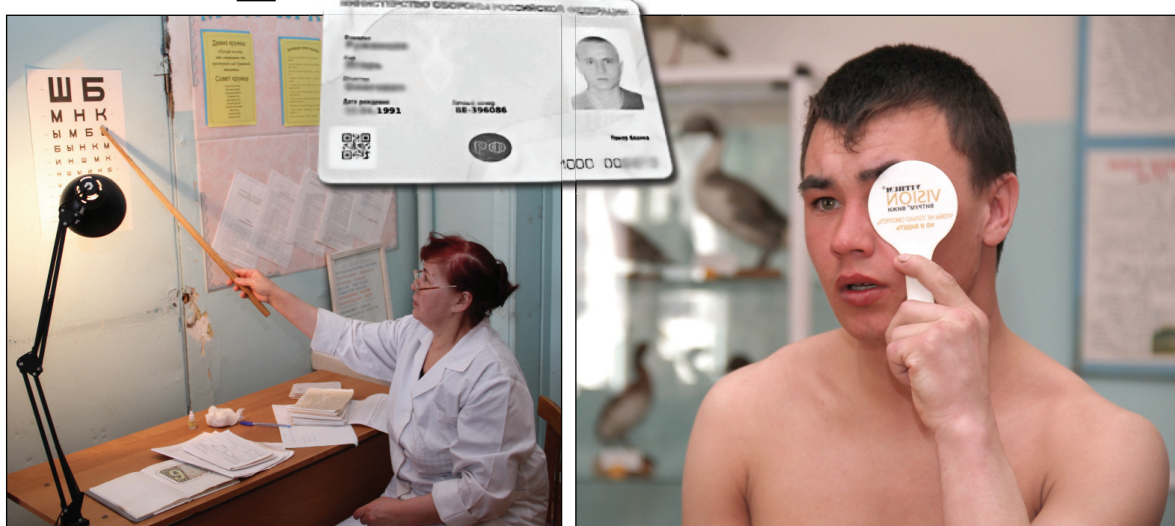
• 300 параметров содержит персональная электронная карта призывника. В ней в том числе зафиксированы его биометрические данные. | Фото 2011 года.