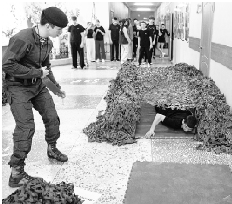
«Экстремальные условия» участникам обеспечили коридоры и спортзал школы

Кручение яиц. Двое и больше игроков раскручивают яйца: чья крутится дольше, тот и выиграл.