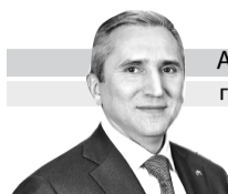
АЛЕКСАНДР МООР губернатор Тюменской области

Уважаемые земляки! Поздравляю православных христиан со Светлым Христовым